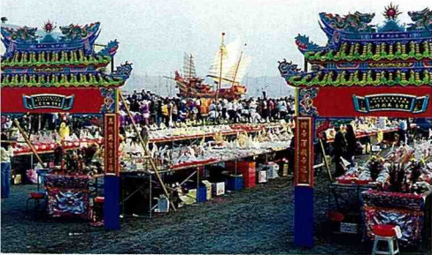
東隆宮「迎王祭」的壓軸好戲就是燒王船。

當然東港的其他鮮活海產也令人垂涎三尺，黃昏時刻到「華僑市場」，三五好友品嚐生猛海鮮，搭配生啤酒，正是夏夜的東港寫照。