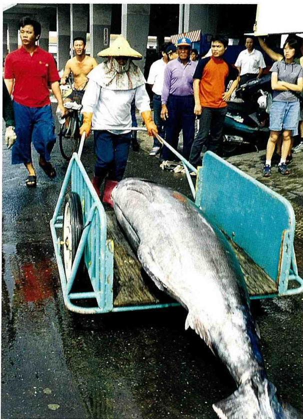
■ 請讓路，黑鮪魚來了！