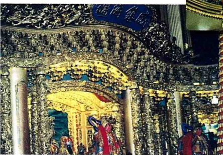
鎮海宮正殿是廟宇建築的精品。