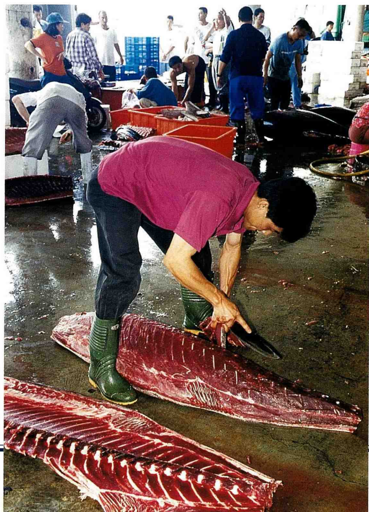
■ 最新鮮的鮪魚生魚片。