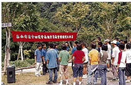
■ 初級會員訓練為國中生之訓練。