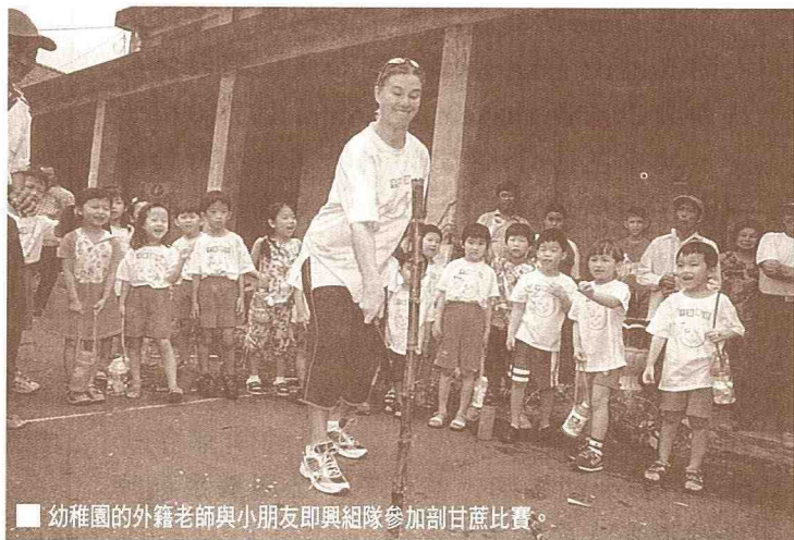
■ 幼稚園的外籍老師與小朋友即興組隊參加剖甘蔗比賽。

剖甘蔗趣味競賽是在煮粽子空檔時進行，共分6組參賽，由農事、四健合5人一組，依一刀剖下長度為最，雖是看似簡單，卻是結合了速度和力道，兩者配合得當，才能有好的表現。有些人在賽前臨陣磨槍，拿起甘蔗猛剖，待比賽哨