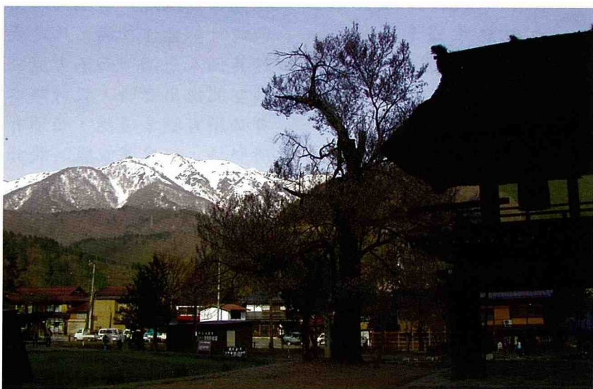
■ 孤立在主峰白山山脈下河谷地區的白川鄉，以獨特的傳統建築、生活方式及山川美景，發展觀光產業。

4年前筆者在阿里山鄉茶山村帶動居民創造出「茅草涼亭部落」，活絡了山村的休閒農業，國內其他原住民部落紛紛組團參訪，欣賞茶山茅屋之美，並探討轉型之道。筆者茶