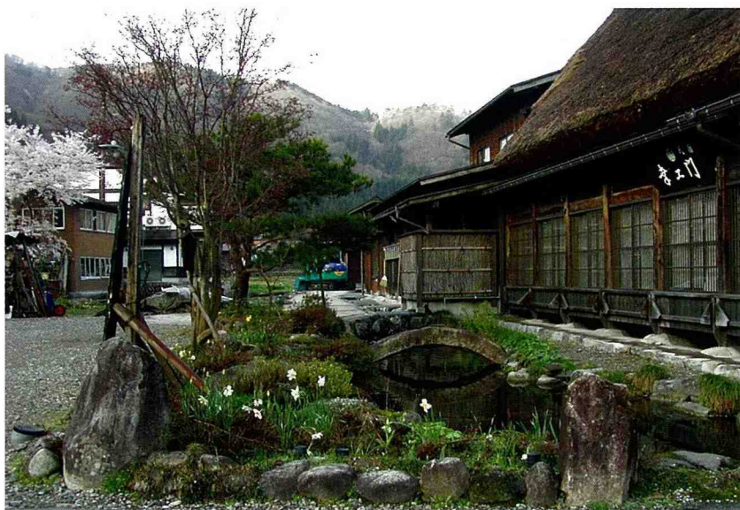
■ 日本鄉村的庭院造景。

保存運動，1971年居民成立「白川鄉荻町合掌屋村落自然環境守護會」，訂定住民憲章，其中有「不賣」、「不租」、「不破壞」合掌屋三原則，1976年被選定為「國定重要傳統建造物群保存地區」，1995年被世界遺產委員會選定為「世界文化遺產」。