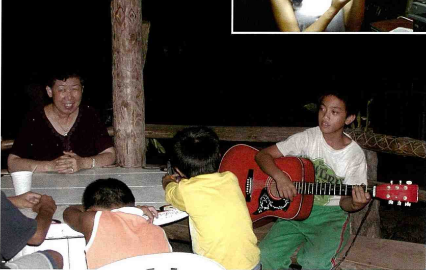
■ 楊小弟在涼亭中彈吉他，帶小朋友唱茶山歌謠。