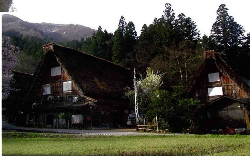
■ 雖然名列世界文化遺產，合掌屋目前仍在居住使用中，這種動態的保存方式，是古蹟活用的典範。

可尋覓出幾個「令人俯仰其間久久不忍離去」的角落。茅草較不耐久、不易防水防火、材料取得不易等問題，使浪漫的茅草屋從台灣鄉村逐漸消失，只能聽耆老追憶茅舍生活點滴，或者零星見於農村慶典之場地佈置，公部門更要求避免使用於公共工程，於是造就了目前所見「塑膠碗式」堅固耐久