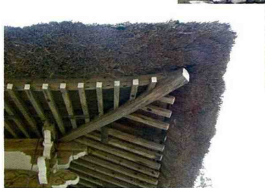
■ 鏡頭下透視茅草屋頂的結構。