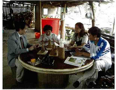
■ 作者(左)當年在涼亭下與居民溝通，了解茶山人的想法。

落、台中理想國等)，另一方面透過協商，請承包商務必將涼亭等與茶山文化相關的部份，直接交予部落施工，總工程費約1300萬，其中約500萬請村長直接安排部落施作，涼亭部份則定訂規範，各家自行建築完成即予補助。這樣的安排，對居民內心起了重大的變化，也就創造出獨特的工程文化：