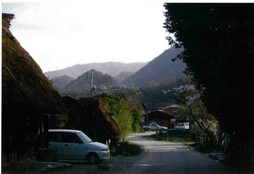
■ 合掌屋聚落中，蜿蜒的鄉間小路。