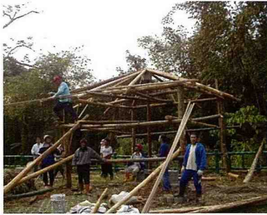
■ 居民參與茅草涼亭的設計與施工，是茶山村開創的施工文化。