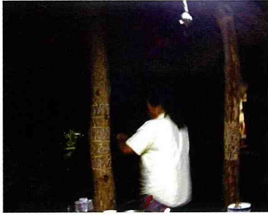
■ 村民雕刻自家的凉亭柱。

茶山村氣候炎熱，尤其是夏季，室內溫度頗高，有時又有驟雨，村民喜歡在門廊等半戶外空間休憩、飲食、唱歌、