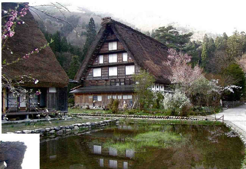
■ 合掌式的茅草屋散落在稻田、池塘、農路及綠林間，展現「四百年歲月不驚」的寧靜之美。

隨著時代的演進，建築材料日新月異而且容易取得，原本可創造更豐富的建築景觀，卻因為缺乏良好的規劃設計，使得農村建築千奇百怪，聚落整體景觀更是凌亂不堪，遑論