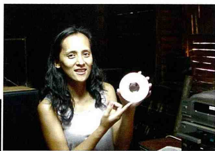
■ 茶山村民組織珈雅瑪樂團，新近出版音樂光碟。

為了塑造部落風貌及促使居民積極參與，舉辦了多次的說明會(說明社區營造之觀念與作法、先進國家如德國鄉村的新風貌作法等)、座談會(探討規劃設計觀念與草圖等)、社區參訪(如參觀南投雙龍村布農族部