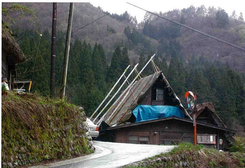
■ 這棟茅草屋正在準備更新屋頂的工作。

部，被指定為特別豪雪地帶，海拔從347公尺至2,702公尺，該鄉最大的特色是村內有113棟大小不一的茅草頂古老農宅群，由於屋頂形狀像雙手合掌，故名合掌造屋。目前合掌屋仍在使用中，例如當民宿、商店，傳統農宅原型展示屋等。