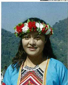
■ 山林中的茶山姑娘。

當時，筆者曾參觀在鹿港舉辦全國社區總體營造展，記得其牆上揭示「原住民部落推動社區總體營造的目的」為「找回自己文化的尊嚴，維繫部落的精神與家族的情感，為部落尋求活潑的生機。」筆者乃將此與城鄉風貌的目標共同宣導，造村活動即在此理念下展開。例如常與原住民共勉：