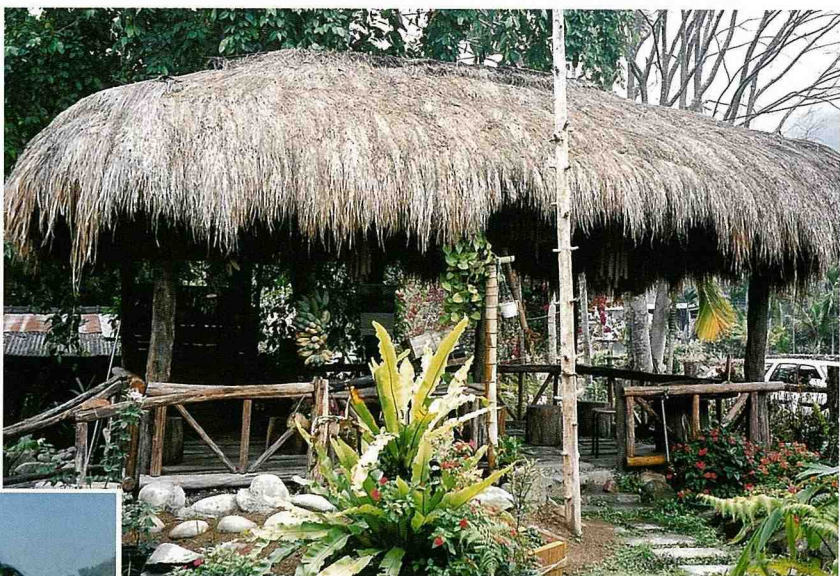
■ 茶山村的茅草涼亭，是實現分享文化的場所。