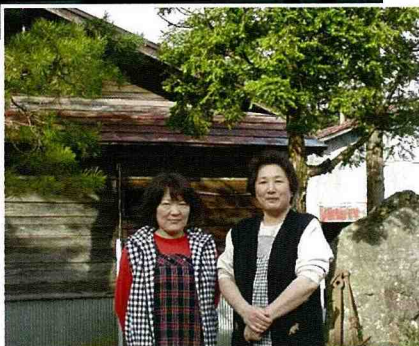
■ 兩位民宿女主人，親切待客，親自送客。

有一、二、三級古蹟以及歷史建築的指定，台灣尚未有世界文化遺產。其中原因，常有人以台灣只有四百年的歷史，與中國大陸、歐洲的數千年歷史相比，歷史太短了，但是合掌屋聚落也只有四百年，或許是因為台灣不是聯合國的會員國吧？國內古蹟學者是否也可以將一級古蹟以世界文化遺產的指定標準嘗試加以自我評估，其成果至少可以作為推廣古蹟保護與再利用的參考文獻。