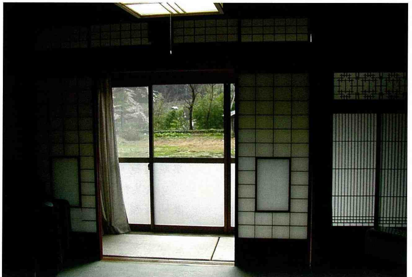
■ 合掌屋民宿深具魅力。

5. 每年修茅草屋數間，全村合作，手工打造，是村民情感凝聚的最佳寫照。茅草有其壽命，以往由於在室內使用火爐，其煙燻的效果，有防腐功能，40-50年才要更新，但是目