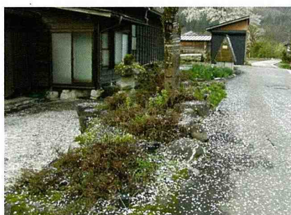
■ 人間四月天，落英似雪。

2. 在某期間或者某世界的某種文化圈裡，對建築、技術、紀念碑、都市計畫、景觀設計之發展有巨大影響、促進人類價值的交流。