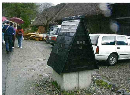
■ 消防栓也設計成合掌式的造型。

顧歷史，村民曾經覺得住茅草屋象徵貧窮落後而紛紛加以改建，30年前開始推動文化資產