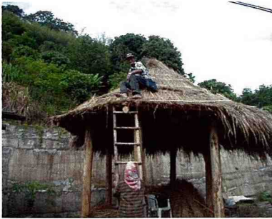
■ 親自施工的楊老先生，當年78歲。