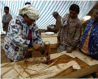
■ 村民設計製作自家門前的木雕板。