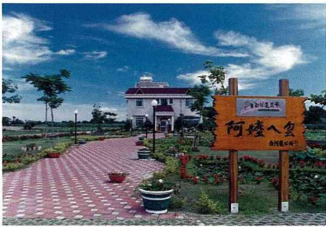
台南白河鎮「阿嬤八婆」民宿。

時不來而造成損失，後來採預約訂房並預付訂金時，營運大為改善（預付金五成最理想），農曆過年，預付金甚至提高到全額，這是過去的經驗，僅供參考。