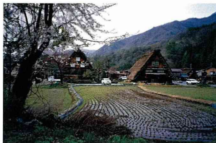
日本白川鄉的合掌屋民宿。