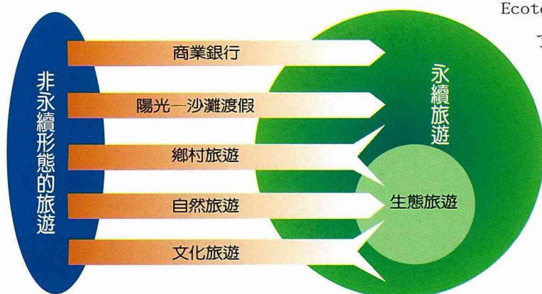
圖一 視生態旅遊為一種永續發展的觀念

了一個簡要的定義：「生態旅遊是一種到自然地區的責任旅遊，它可以促進環境保育，並維護當地人民的生活福祉」。國際自然保育聯盟(IUCN)在1996年進一步闡述生態旅遊為一種：「具有環境責任的旅遊型態，旅行到相當原野的自然地區，目的是享受和欣賞大自然(以及連帶的文化現象，包括過去的和現存的)，這種旅遊活動的遊客衝擊度低，可以促進保育，並且提供當地人積極分享社會和經濟的利益」。