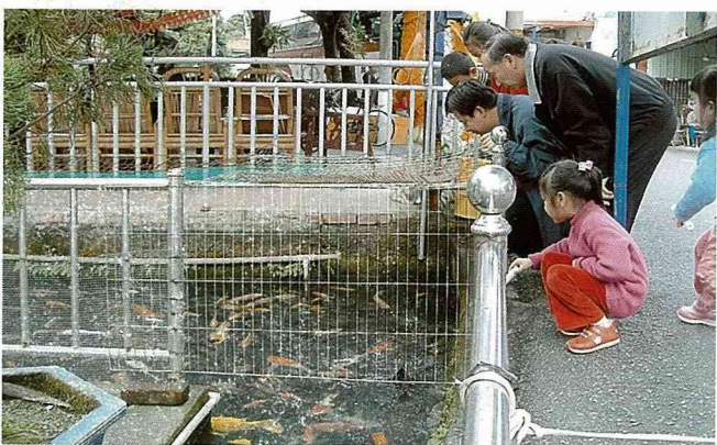
這條大水溝彎魚池，是九如鄉民引以為傲的社區建設。