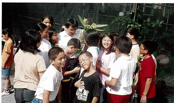
小四健會員也要學習蘭花栽培技術。