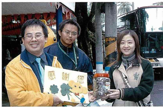
九如社區接待來訪的朝陽四健伙伴。