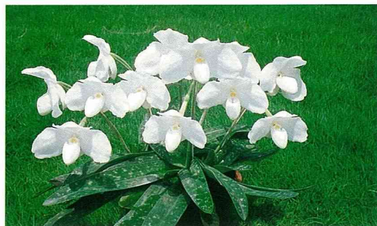
稀有的台灣拖鞋蘭。