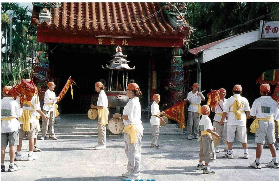
豐田社區熱鬧的「跳鼓陣」，拉近了現代與傳統的距離。