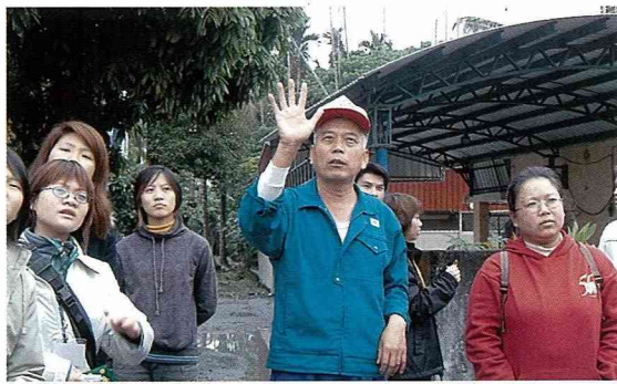
九如鄉耆老村的解說員，神情專注的介紹社區文物。