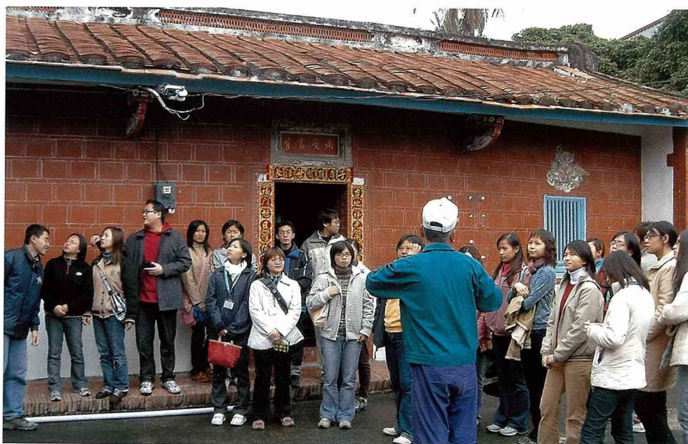
耆老社區古厝前的解說。

安全蔬菜栽培作業組；並由豐田社區理事長提供，將荒廢多年的活動中心變裝為四健教室，成為九如鄉的四健精神堡壘！過程中，當然經過多次努力協調及動員整理，在這裡可以看到活潑的小會員們活動的身影及甜蜜的笑聲，在這兒大家還曾共同許下美好燦爛的心願——未來的日子還很長，我們會更加努力為九如鄉四健會付出！