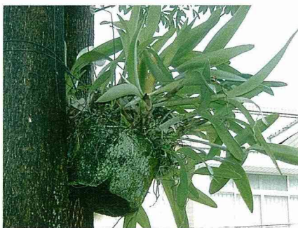
樹上的蘭花是九如社區的特有景觀。