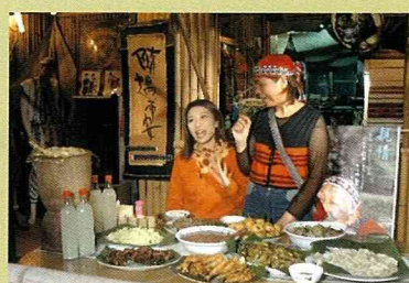
茹旦工作室接受東森電視台專訪。