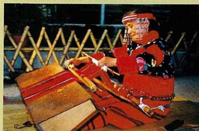
編織讓泰雅族的夢想成真。