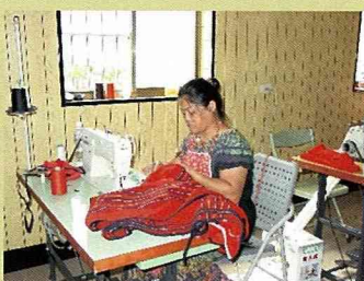
泰雅編織，品質穩定。