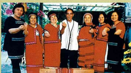
茹旦工作室的織工合影。