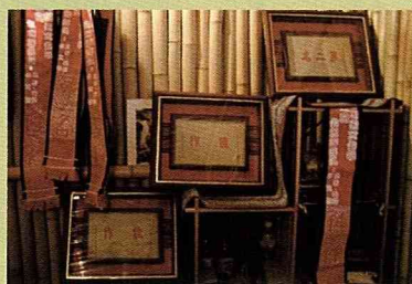
91年度獲得的手工藝競賽獎牌。