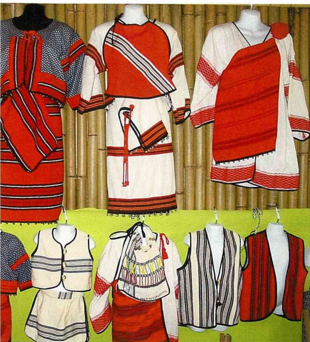
(上) 泰雅族傳統服飾。 (右) 改良的原住民服飾。