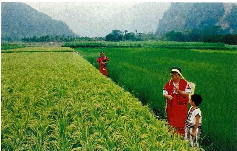
清流社區是泰雅族部落。