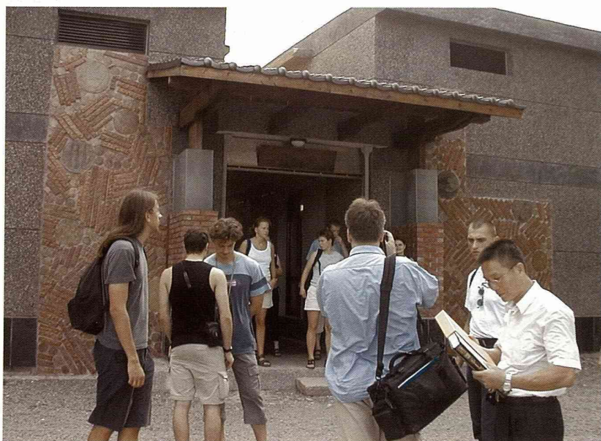
經過更新的三芝鄉農會老穀倉。