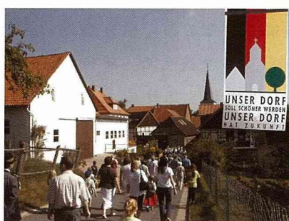
德國政府推動農村競賽有40年經驗。