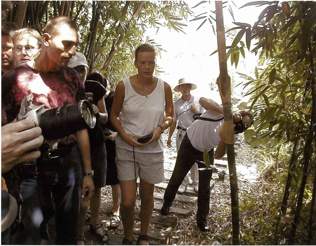
竹林小徑漫步，是德國人的最愛。