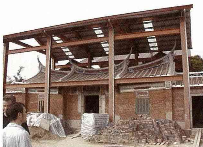
新埔鎮一處200年歷史的傳統三合院，正小心翼翼的進行翻修。

的坡地果園，建築前方有條小溪繞過，後方緊靠著小山坡，高大的擋風竹林捍衛著這個恬靜的農莊，往前方遠眺，是個元寶型的山脈，據村長說，這正符合所謂