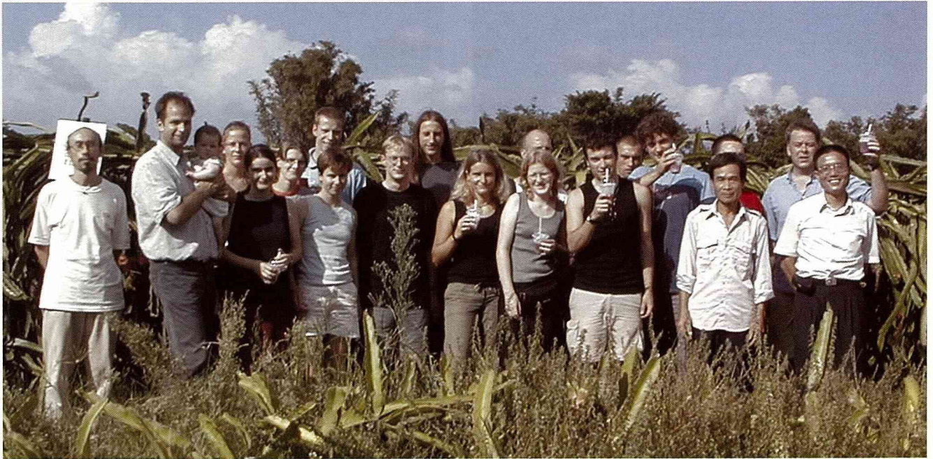
火龍果園裡的異國體驗，可以說上好幾天。