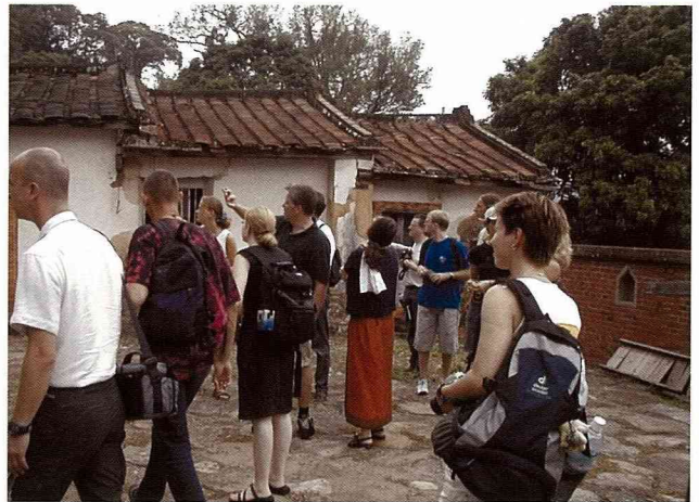
這一棟老舊三合院在台灣沒有任何相關法令予以保存或補助。

首先，我們來到一位種水梨及柑橘的農民家裡。這是一個圍繞著傳統客家三合院佔地約一甲