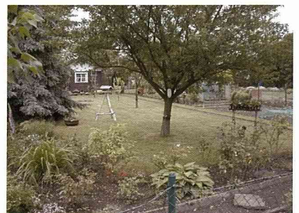
德國市民農園允許搭建簡單的小木屋，發揮休憩功能。