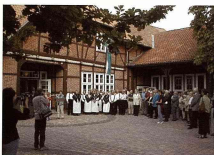
在德國，農村事務必須由居民參與一起推動。

難以建立永續發展的基礎，反而會帶來更多的發展阻礙。這種現象反映在農村建設上尤其明顯，因為農村相較於城市有更嚴重的傳統產業轉型、人口流失及文化失落等問題。