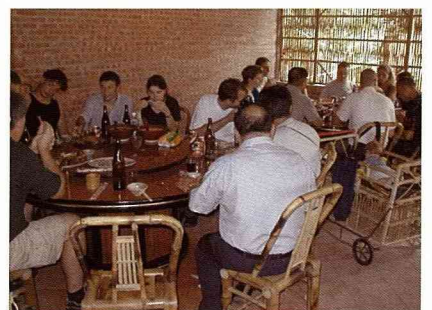
竹屋餐廳內用餐，竹製椅子與嬰兒床精緻輕巧，而且與環境相融。

的坡地果園，建築前方有條小溪繞過，後方緊靠著小山坡，高大的擋風竹林捍衛著這個恬靜的農莊，往前方遠眺，是個元寶型的山脈，據村長說，這正符合所謂