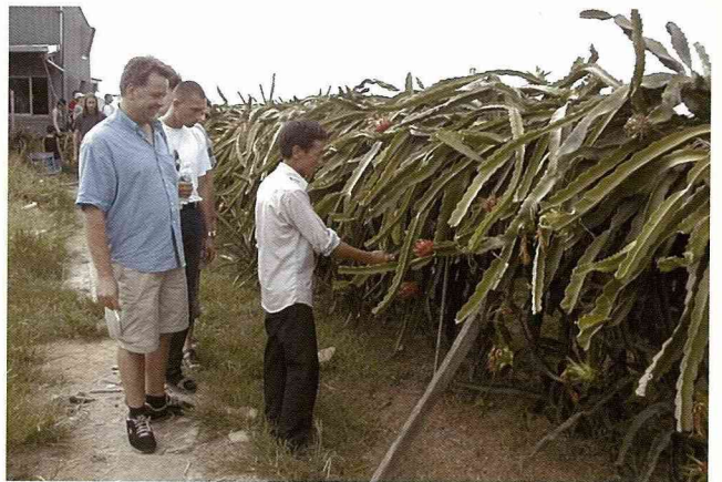
第一次看到火龍果植株的德國人，真是大開眼界。

限於農產品種類貧乏及飲食文明之差異，台灣在這方面很有潛力，也許有一天，台灣三芝鄉的山藥茶也能在德國超市上櫃熱賣呢！