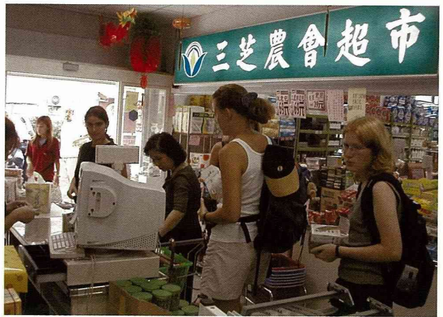
三芝鄉的山藥茶是德國人樂意購買的「伴手」。

們團員中曾有人在德國的亞洲商店中看過，但怎麼用，就要問中國人了。在這裡加工製成山藥茶，依口味的不同分別添有咖啡及杏仁粉，喝起來格外香甜順口。這一杯山藥茶是農會請的，但實在是太棒了，所以我們每個人在旁邊的農會超市分別買了數包，準備回國饋贈親友。