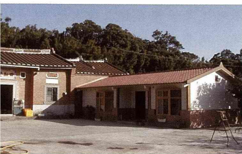
新埔農村舊合院新護龍的建築運用，是德國人的熱門話題。