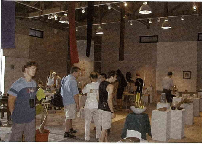
老穀倉的傳統氣質襯托藝術家的陶藝作品，楚楚動人。