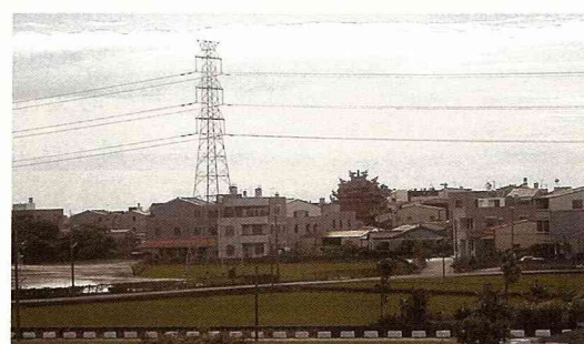
台灣高密度的土地利用方式，讓德國人有窒息感。