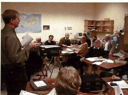
德國推動一個農村更新計畫，工作群必須經常開會討論。

同樣的問題，這園區在自然保育方面的用心，不及他們在經營遊客方面的努力。在現今經濟掛帥的台灣，要業者將心力同時用於環境保育，恐怕是棘手的挑戰，這就需要政府透過類似農村更新措施予以輔導補助，在發展經濟的同時也能建立永續的發展觀念。