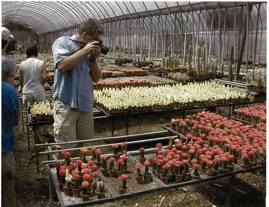
爭奇鬥豔的仙人掌小品盆栽，緊緊扣住德國學人的目光。

我們行經陽明山國家公園。台灣國家公園的標準與德國是不同的，在這裡，國家公園內興建聚落似乎是被允許的，尤其公園的地理位置居高臨下，可以俯視