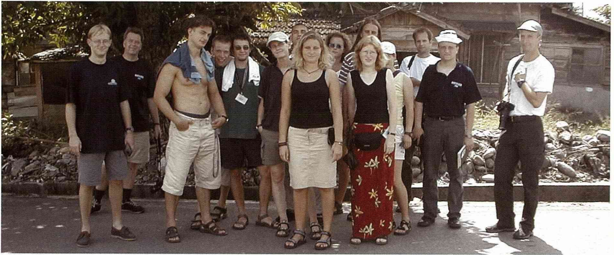
2002年仲夏，德國羅斯托克大學農村文化及環境保育系教授及學生一行17人，走過台灣農村。