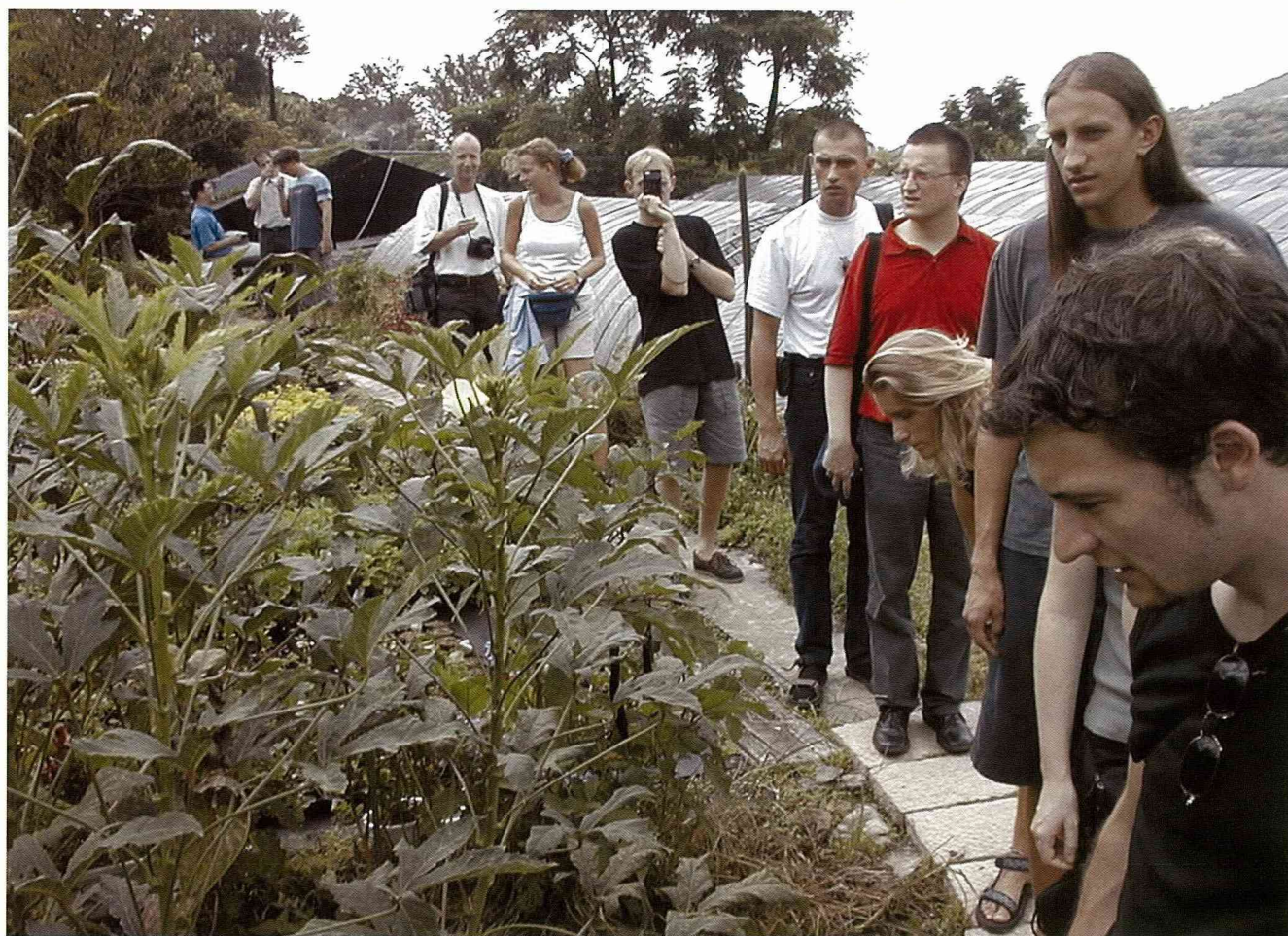
豐富的植物生態，讓花園一角生意盎然。

這個家庭企業在早期以種植水果及蔬菜為主，今天則首要集中發展休閒農業，而傳統染布技術及產品也可以在這裡體驗到。