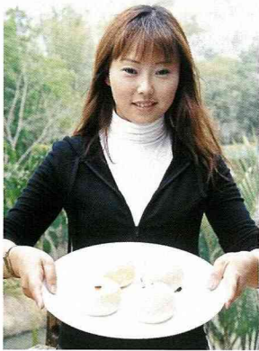
自己做的牧草饅頭。