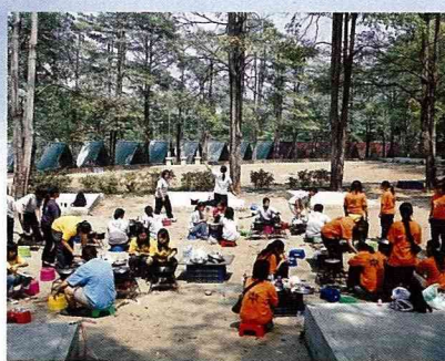
公民訓練戶外野炊。

帶目的型觀光農園，引進滑草、騎馬、協力車、農特產展售、農教訓練、森林浴、草原遊憩、風箏、親子體能及自然生態等農業型選項，一躍成為全國知名的觀光農場，成為1989年休閒農業研討會的具體範例，並在1991年獲選為第一批有合法標章的風景遊樂區。