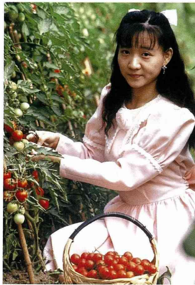
鄉村氛圍下的農事體驗。