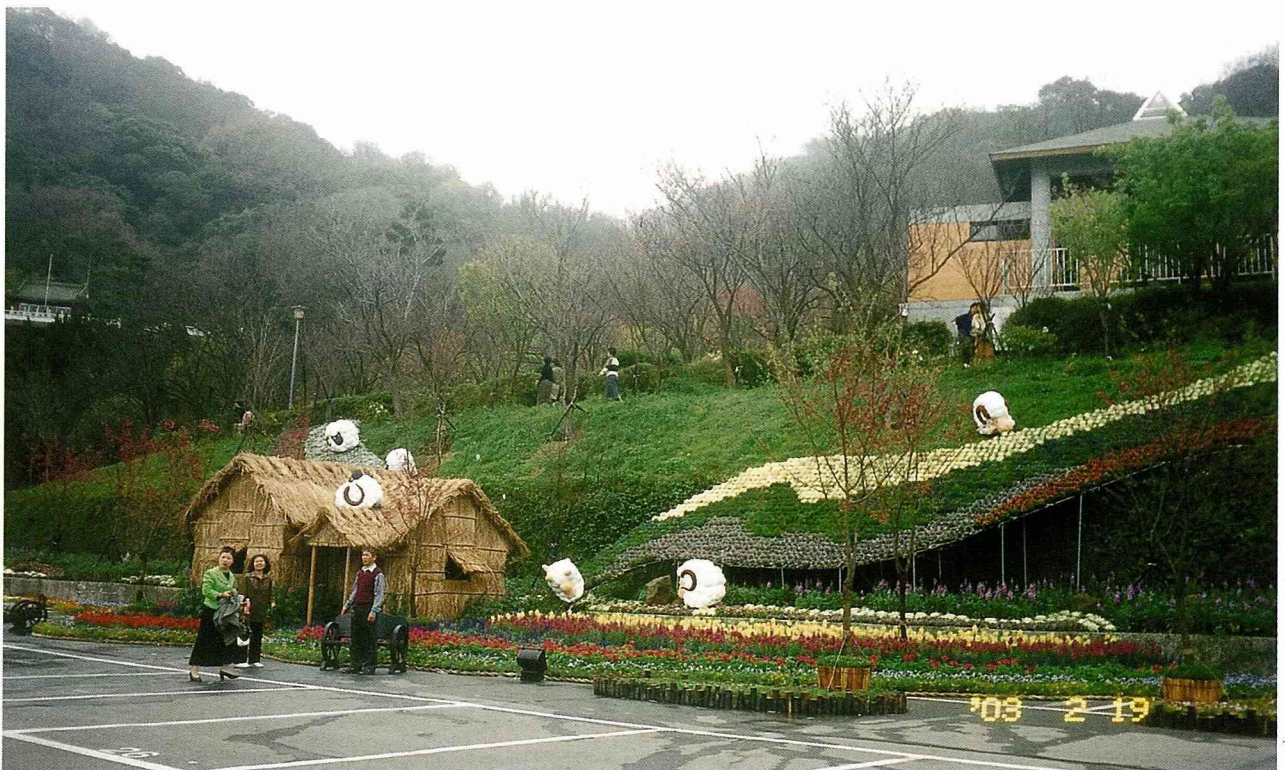
陽明山上，吉羊處處。

木頭、保麗龍、鐵絲、瓦楞紙、麻繩等材質，都是園藝廣泛取用的素材，可以雕刻遊騎兵、建構城堡；可以製作綿羊、山羊；可以切割成為小天使、白雪公主；可以紮網為米老鼠、兔寶寶，尤其這些材質幾乎都可回收再利用，城堡變身為小木屋；在屋頂加上芒草，精靈居住的鞋屋就成