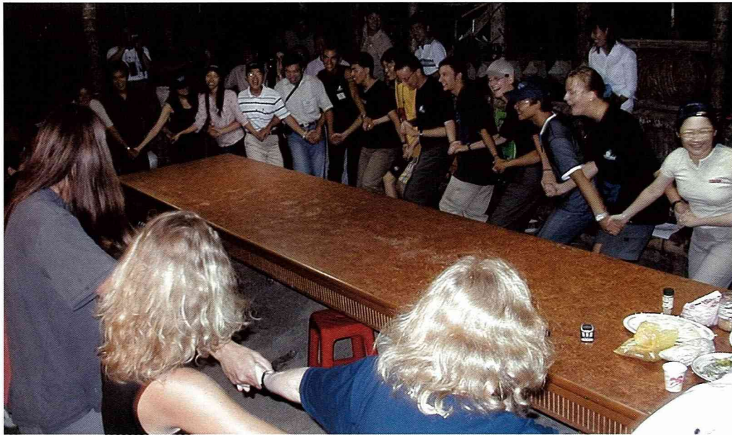
狂歡到深夜的惜別宴。

美的晚餐，來台灣每天的飲食，從來沒讓我們失望過！這些餐點材料全是由未來村的婦女們精心準備的。餐後活動由三方彼此較勁唱功，分別用自己的母語來表達，但合唱部分則用英語發聲；讓我們印象深刻的是原住民婦女嘹亮優美的歌聲，令人驚訝的是，有不少歌曲的旋律竟然是無分國界呢！