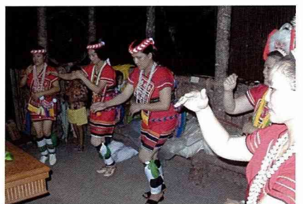
原住民傳統歌舞表演。