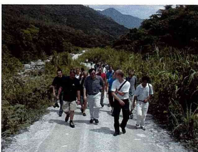
以生態工法復育的野溪。

聽完這場極具啓發性的簡報後，接下來我們要實地了解當地的野溪復育計畫。漫步穿過農村，我們來到溪邊。這是一條山溪，匯集來自環山的水流於這谷地內。寬廣的溪床不難讓人聯想到，溪水在颱風降雨期暴漲的情形。降雨大約集中在颱風季節，每年約兩三次，會形成帶動碎石的洪流，好在該溪不會對附近村落造成重大危害。