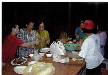
未來村的媽媽們準備餐飲食材。