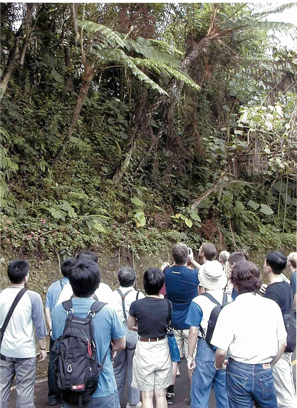
環潭步道上漫步，認識植物與昆蟲。

我們聆聽一場李教授關於「未來村」的演講。在「未來村」計畫中，除了農村更新外，還有周遭河床的整治。重點是希望能藉此創造當地就業機會，讓農村再次成為年輕人與老年人的故鄉。角色定位、經濟發展、生態建設，是這計畫的三大主軸，以德國經驗來看，這是農村空間發展應該要注意的。到目前為止，李教授所推動的措施，是在沒有