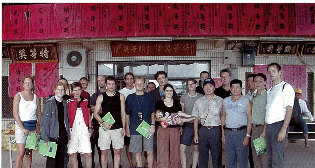
掛滿匾額的牆面，說明茶園主人是常勝軍。

這些有地方特色的田野畫面，將有助於農村重拾家鄉味，也是吸引外地人前來的重要元素，畢竟在人口高密度的台灣都市要覓得相同的休閒空間，似乎不太容易吧！