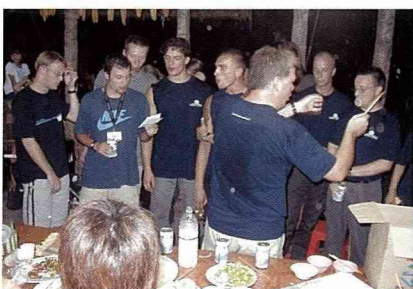
趣味性的歌藝較勁。