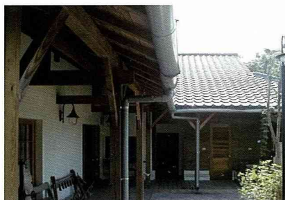
經整修過的農村文化中心。