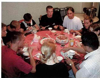
茶宴上品嚐特製米酒。