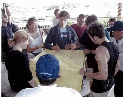
每個人在天燈上寫下願望。