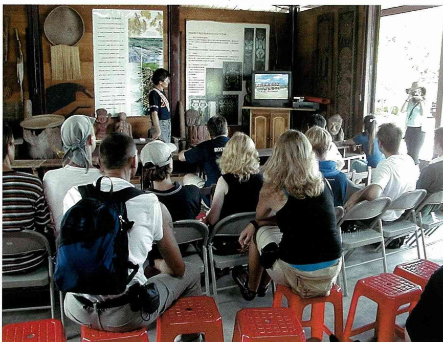
原住民社區的教育中心。

美麗的樹形及大葉片，相當吸引我們。可惜的是，當時道路工程正在進行，並未考慮到植物生態，以致樹圈完全被不透氣的柏油鋪面所覆蓋，影響樹木成長。也許應適當地縮減道路寬度，將柏油改成碎石或是留點土地給樹木，讓雨水有機會滲透地下，樹木就會長得更好。這兩棵麵包樹是當時日本人種的，他們就住在樹後方的農家內，在約1200平方公尺的土地上，有蔬菜園及豬圈，自給自足，而在村莊外圍的農地中，這家人還持有五甲地。