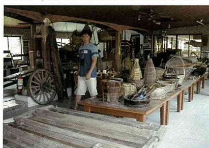
原住民編製設計的漁具。

這天中午，我們再次來到一個阿美族馬太鞍聚落午餐。飯後沿著村莊外圍漫步觀察周遭景致，有大片荷花池，池裡養著魚、牡蠣及蝦，我們的目標是前方的一個農村教育中心。在教育中心內，一位原住民向我們介紹居民的生活及工作方式。他說，這個部落是個自給自足的社區，