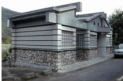
與環境不能相融的建築設計。