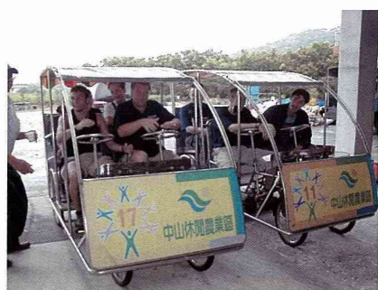
改良的四輪休閒車。

根據曾多次來過台灣的 Bombeck 教授說，這個農場相對於其他過度以休閒為主的農場而言，它仍帶有相對較濃的農村味，因此，若以德國農村更新補助條件來看，通常這類型「純農家」會優先獲得政府補助協助轉型；也就是說，農村更新的計畫必須先照顧仍在務農的農民，至於那些非務農者所經營的「渡假村」，往往很難獲得德國政府的補助。而在這個案例中，我們發現農村畫面深深影響著農場的整體景觀，其唯一性與地方性，正是外地人所嚮往的，也是農場較具競爭力的地方，因此，若是過度開發，就像台灣普遍見到的情