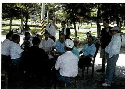
廟埕前樹蔭下，是村民生活的重心。

我們來到離村莊不遠的一個廟宇，也是採日式風格建造的，台灣光復後適度改建為漢人建築