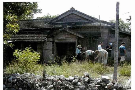
仍保有農村風貌的老房舍。