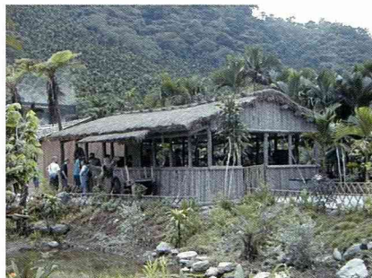
有原住民特色的傳統建築。