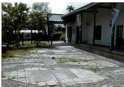
豐田社區是早年日本人規劃設計的農村。

據說設計者是台北人，這樣就不難理解了。聽環政所的蔡教授說，台灣在「城鄉新風貌」計畫推出後，為避免類似的情形出現，便有專家建議推廣社區規劃師制度，讓規劃者能進駐地方，