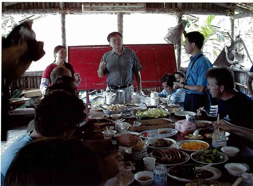
特別安排的德國式午餐。