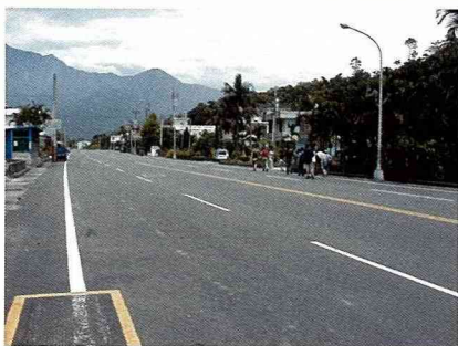
德國學人建議，未來村的這條馬路應「窄化」，才能恢復鄉村道路的親切尺度。

政府補助款的情況下，透過原住民自力進行的，因為村中人口有將近40%的原住民，具體落實了居民參與的精神。