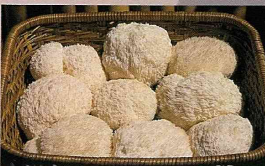
農場栽培生產的「猴頭菇」。

明日葉原產於日本八丈島火山岩區，根據歷史傳說，為秦始皇所追求的長生不老藥，後經國人自原產地引進，在高海拔山區試種栽培成功，明日葉因含有高單位有機鍍，有益人體身體健康，可作為餐桌上之美味佳餚，更是養生之最佳良品。