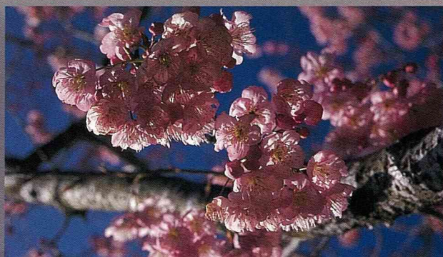
農場的櫻花不遜阿里山。

龍雲休閒農場係以昔日農家房舍整修而成，開放供生態教育研究、登山旅遊、休閒渡假、開會研習的農家民宿。熱情的農場主人，最愛與遊客閒話家常，沖泡自家栽種調製的明日葉茶，與您暢談農場裏各種藥用植物的生態與效用，如杜仲、銀杏、前胡、十大功勞、明日葉、猴頭菇等，讓來此渡假的遊客，對傳統藥用植物的認識與應用，皆能獲益良多。除認識藥用植物外，農場更以各種藥用植物，精心調理成美味的藥膳，提供遊客口腹享用。