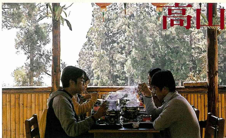
農場自然優雅的餐飲環境。