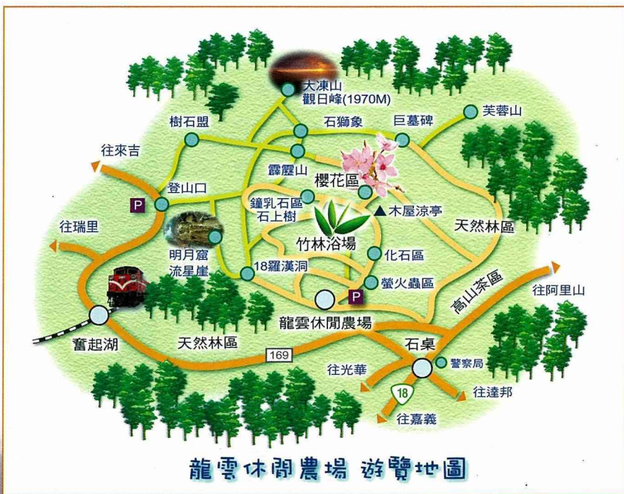
龍雲休閒農場遊覽地圖