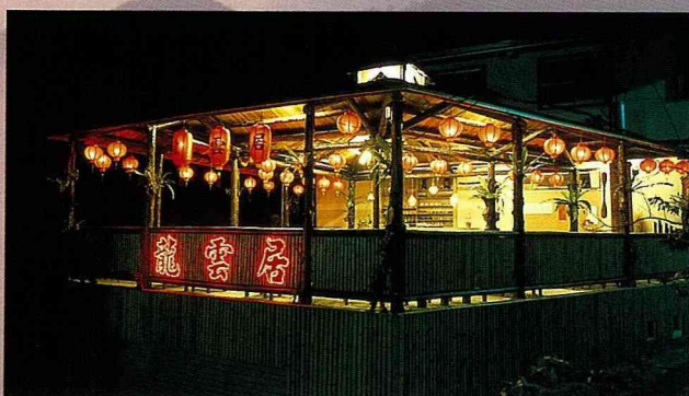
農場內「龍雲居」夜景。