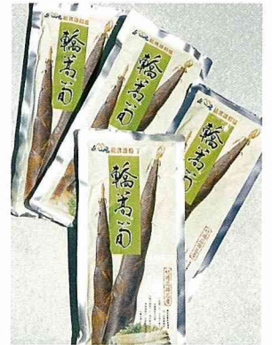
轎篙筍精美真空包裝。