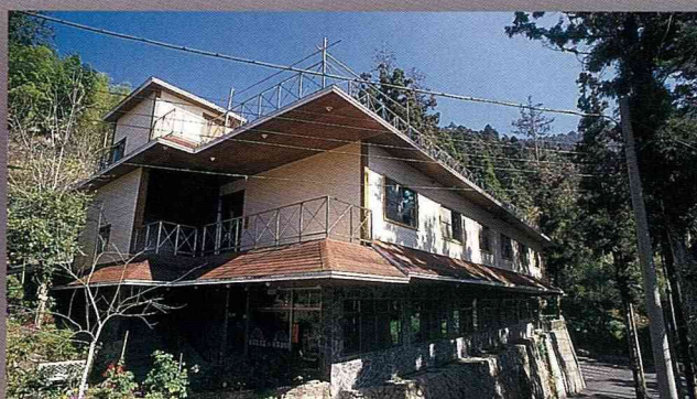
農場溫馨雅緻客房外觀。