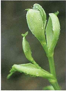
明日葉是養生良品。