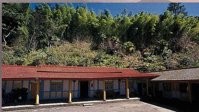
龍雲休閒農場三合院的農舍。