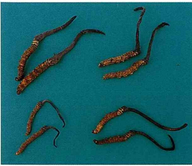
圖1. 不同產地之冬蟲夏草(中華蟲草)，左上為雲南麗江所產，右上為西藏所產，而右下為四川所產。蟲草上部為子座，下部為蝙蝠蛾幼蟲蟲體。