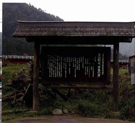
京都府美山町「北」聚落

0.5%，可以說是生活條件嚴酷的山村，冬季積雪2~3公尺，因而被指定為特別豪雪地帶，過去是盛行養蠶的地方，現在每年的觀光客人數達107萬人。