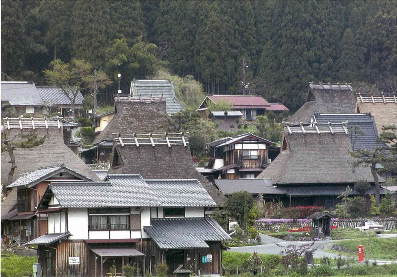
京都府美山町 「北」聚落

(2)可以設在村落內的商店，以利用傳統性民房供傳統工藝品之製作、展示、販賣，及提供手工製作之傳統美食，或傳統食品之製作、展示、販賣者為限。