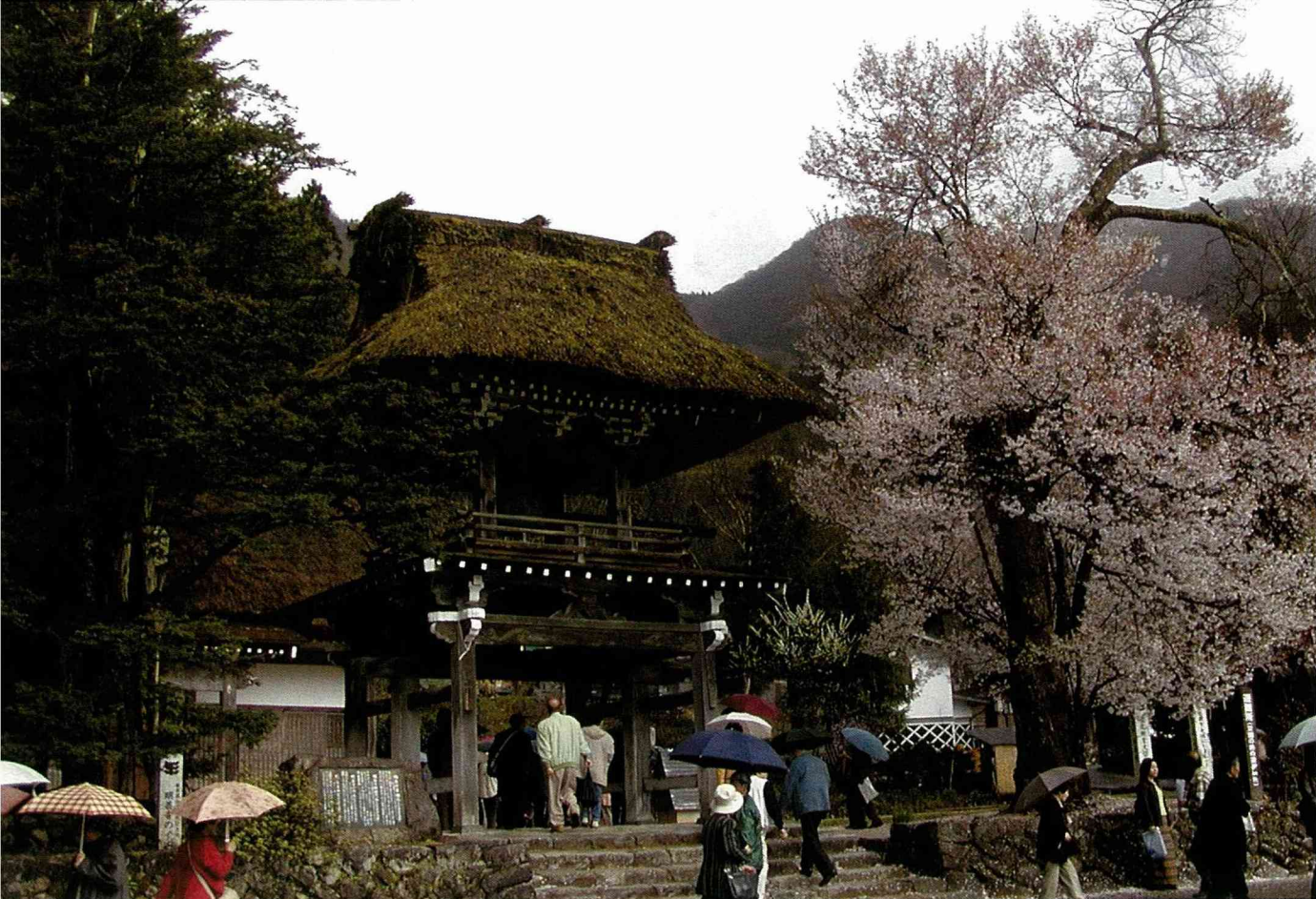
岐阜縣白川町「荻町」聚落

食店；神社之例行祭典、消防栓灑水的防火活動；冬天由民房透露出來的夜間照明等都變成非常有名，在這時期的觀光客更多。本聚落可以說是積極推動觀光化的實例。