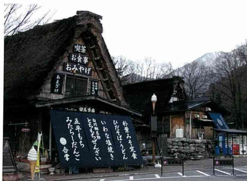
岐阜縣白川町「荻町」聚落

這是在「白川鄉」很有名的合掌造型的民居聚落，其特殊是屋頂的形態，雖然地點是在山區，但已發展為觀光地點，冬季也有觀光客到訪。聚落在1976年依據文化財保護法而被指定為「傳統性建築物群保存地區」，更於1995年登錄為「世界文化遺產」，使得觀光事業更加發展。當地居民對於觀光化之意願也至為強烈。出現許多賣土產的商店及飲