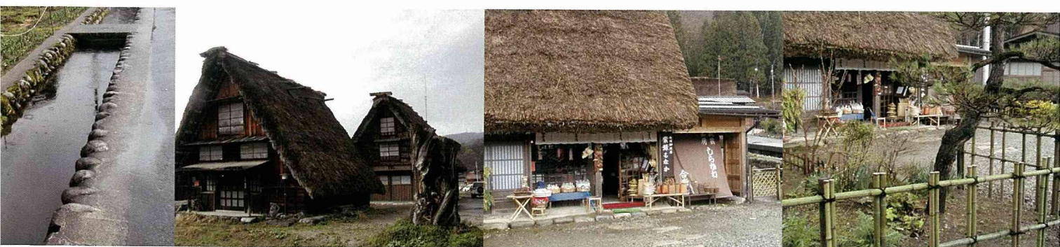
岐阜縣白川町「荻町」聚落