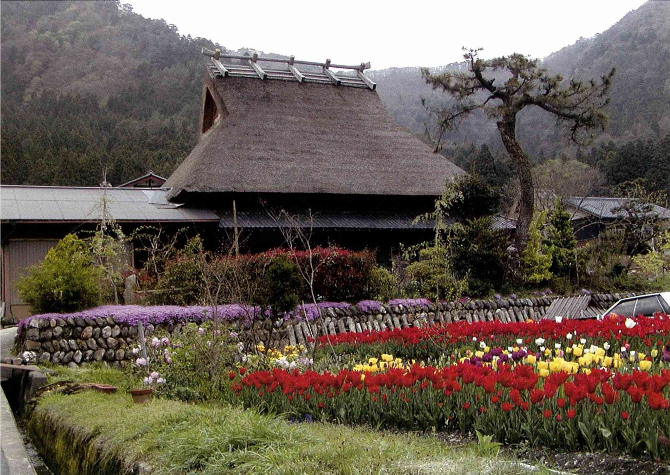
京都府美山町 「北」聚落