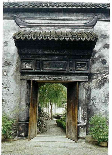
石皮弄之大戶人家。