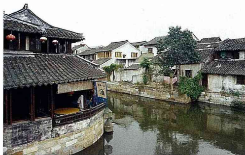
保存完整的西塘古建築。