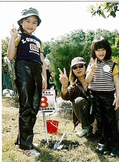
遊客親子植樹紀念。