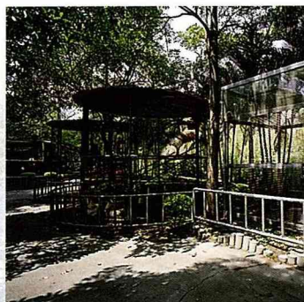
南元休閒農場大鳥園。