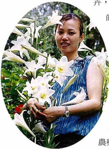
農場培育的麝香百合。「獨樂樂，不如眾樂樂」的開放心態下，將農場對外開放。