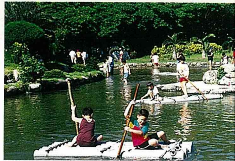
小朋友下水體驗捉泥鰍與划膠筏。

依偎在青青草原邊緣的「台灣島」，是一個仿照台灣全島地形，以石頭與草坪所設計出來，最受小朋友歡迎的島嶼「親水區」。島上栽培了台灣各縣市所代表的花卉植物，以及呈現台灣主要溪流的分佈情形。每逢星期假日，場方都會在親水區域裡，放養活生生的泥鰍與蜆（蚵仔），提供小朋友下水體驗捉泥鰍與「摸蚵仔兼洗褲」的樂趣。島旁的親水健康步道，運用鵝卵石鋪設，因別出心裁地加上水流的撫觸，走起來格外地清涼舒服。