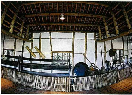
竹屋讓人重溫農業時代的舊夢。