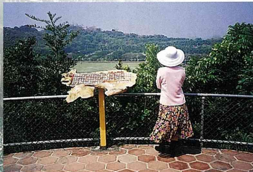
從眺望台俯瞰農場全景。