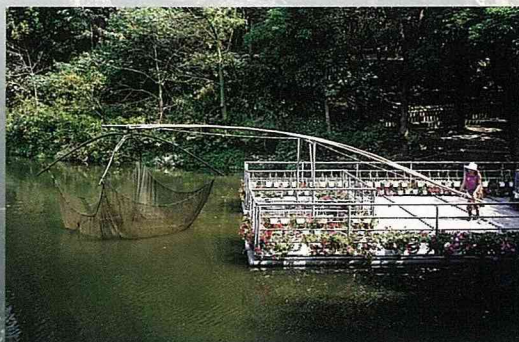
傳統捕魚器具的「吊罾」。

廣大的青青草原，提供遊客運動健身、嬉戲玩耍，又可充份得到心靈紓解的場所。您可以在這享受盡情奔跑、翻滾、聊天、放風箏、打陀螺、玩飛盤等樂趣。