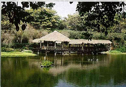
南元休閒農場擁有六個天然湖泊。

當您一進入南元休閒農場的大門，映入眼簾的是天然湖泊與翠綠的大草原，以及為數眾多的花草樹木，以「自然就是美」五個字來形容，正是南元休閒農場的最大訴求。