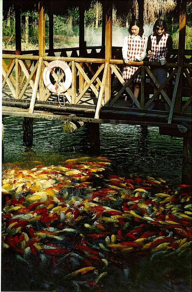
湖泊裏成群錦鯉悠遊。

精心規劃經營10多年的南元休閒農場，活用大自然原始景觀及農村田園文化資源，以保持大自然生態為原則，由於經營方式執著於知性、感性、教育性的生態、休閒之旅，場內備有解說員，為遊客解說場區內的植物，是一處提供國人環境教育與休閒渡假，寓教於山水、田園間的休閒農場！