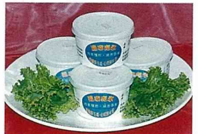
農場特別推介「羅季亮果冰」。