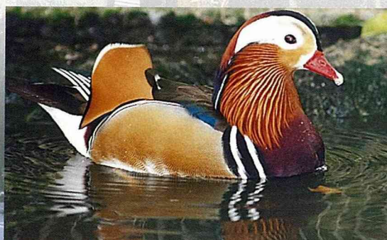
農場鳥園裏飼育的鸚鵡。