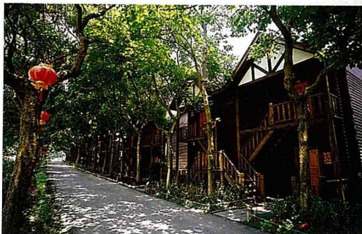
湖畔林木掩映的渡假木屋。