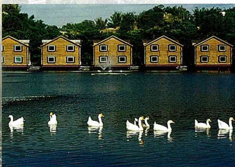
農場內傍湖而築的湖上渡假原木屋。