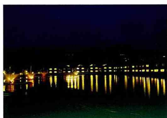
湖畔渡假木屋夜景。

南元休閒農場特別為辛苦的公務人員，辦理兩天一夜四人同行優惠專案，凡每星期日-星期四來南元休閒農場住宿者，就享有超值回饋價 $ 3990及多項優惠，內容如附表所列。