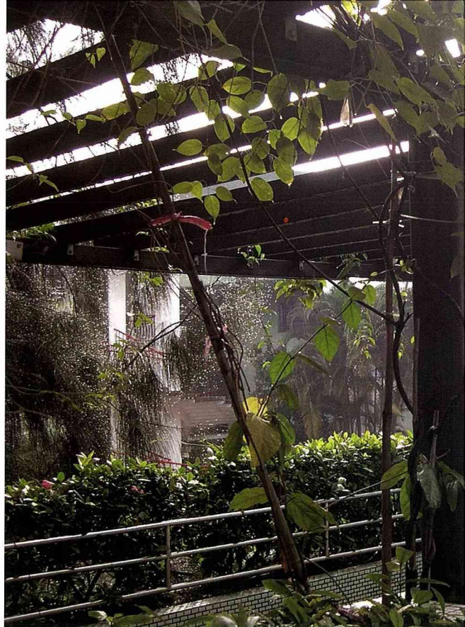
木造的川堂走廊，已經形成美麗的綠廊。

這個願望在他擔任華江國小校長時徹底實現，以華江國小為核心，帶動華江里進行社區總體營造。