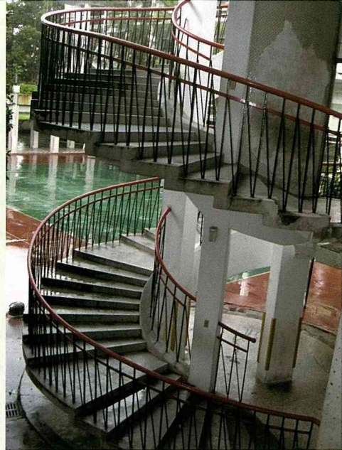
「圓」的意念，在校園內四處游移。

林基在表示，從種植植物的過程中，可以發現生命的豐富與律動，新芽、生根、開花、結果，突顯時光的兩端，開始與結束；蝴蝶、蜜蜂、昆蟲飛來，有時覓食，有時只是想飛，大自然生生不息、環環相扣，孩子從喜歡植物、動物的歷程，懂得愛惜生命、尊重生命，發揮生命的價值與意義，簡單的植栽卻是生命教育的重要教材。