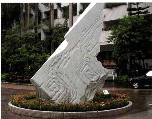
楊英風的石雕作品「水袖」。

華江里接近雁鴨公園，每年9月至隔年4月，華江橋下，雁鴨成群飛舞。候鳥來台度冬，意外成為人間的嘉年華會。冬季清冷的新店溪畔，因為雁鴨的到來，而顯得熱鬧。春天趕走冷冽的風，卻留下雁鴨的蹤影，一樣以藍天為背景，一樣的波浪洶湧，雁鴨飛入華江里、華江國小的步