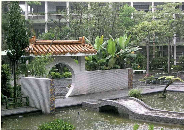
江南風味的庭園設計。