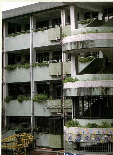
教室女兒牆以盆栽綠美化。