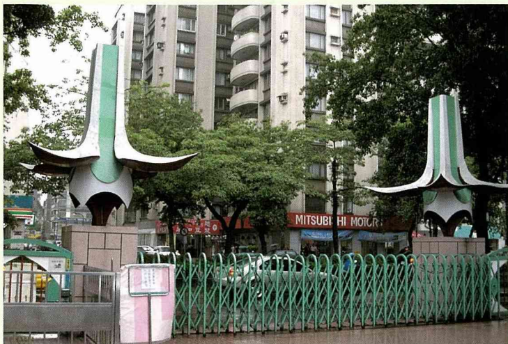
校門口的兩座宮燈。