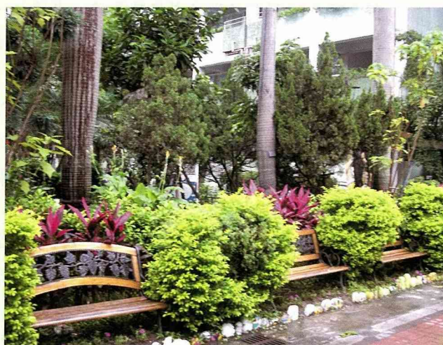
校園內提供師生休憩的座椅。