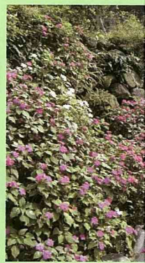
在石塊堆砌的護坡上以草花美化空間。