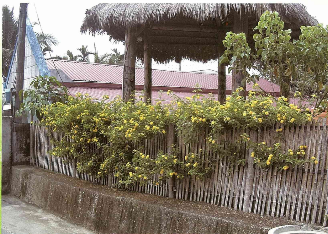
竹圍籬及馬櫻丹，編織街景綠意。

一般人只會把相思木燒製成木炭，作為烤肉之用；但是茶山村民的想法更為生活化與本土化，利用相思木做成圍籬，不僅是一種就地取材的經濟做法，也能讓製作的圍籬與村莊周圍的林相，融成一氣。由於村民大多務農且久居深山中，對樹林裡的樹木觀察入微，他們注意到高大的相思樹每到季節更替時期，就會有老舊枯枝落下，掉落的樹枝有大有小，他們收集這些枝幹，帶回家作為炊飯的生火材料；大的樹幹長約3—4公尺，剝皮後支幹部份仍可在戶外使用10年不會腐朽，因此，原住民在處理這