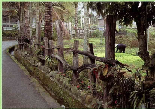
經濟又有地方特色的相思木圍籬。

伸出去，種植高高低低的灌木樹叢，圍出自家庭院的範圍，並巧思安排許多端景，散步其中，令人驚豔。