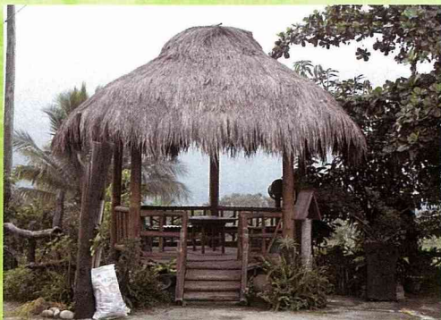
每座茅草涼亭的造型皆不同，有長方形、方形、圓形及複合形等形態。

「茶山村到了！」同學驚呼聲中，映入眼簾的是家家戶戶在庭院搭起的茅草涼亭，屋外圍起相思木籬，沿路伸展過去，從點狀散佈擴及到線狀發展，緊緊