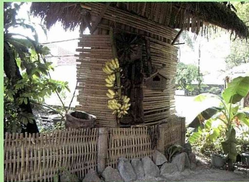
凉亭下一串串的野芭蕉，是茶山居民招待客人用的風味水果。

些相思木圍籬材料時，首先盡量保持其完整樹形，削除分叉細枝，以井字形搭接方式成圍籬，豎立在道路兩旁，構成茶山特有的圍籬景觀，也增添幾分自然野趣，並對木材這種建材，在永續利用、節約資源、環境生態方面，做出了最佳的詮釋。