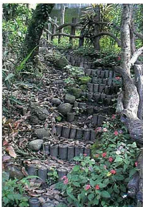
用竹桿為踏階的登山步道。