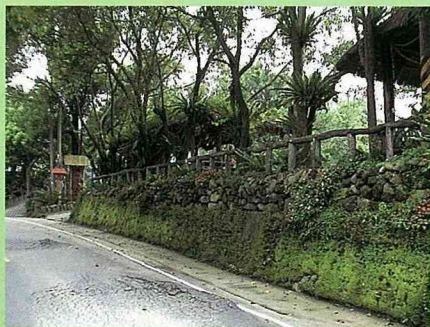
都市化的水泥坡坎，在村民用卵石與樹枝等自然材改造後，逐漸創造出綠色的山地景觀。