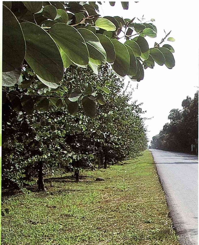
「觸口」段的阿里山公路，兩旁有寬闊的滲水帶、土溝與羊蹄甲路樹。

茶山村家家戶戶都非常重視庭院入口之塑造，屋前空地花木扶疏，高高挺立的重瓣聖誕紅最亮麗搶眼，紅花綠葉妝點下，吸引遊客忍不住發出讚嘆而駐足欣賞。仔細觀察每家門口出入的地方，都利用樹幹搭起簡單的「隘門」，或以塊石壘砌出粗獷的地標，以突顯宅基地之入口；門的左邊豎立著主人雕刻製作的可愛信箱，右邊則站立一片與人同高的木雕作品，作品內容不僅展示主人的工藝技術，也在向路人訴說他們的族群習俗或家族故事。隘門的左右兩邊延