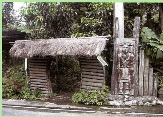
山林小道的入口處「門」的設置及木雕，強化了入口意象。