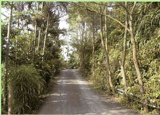
阿里山茶山村的綠色小徑，塑造出自然清新的綠色廊道。