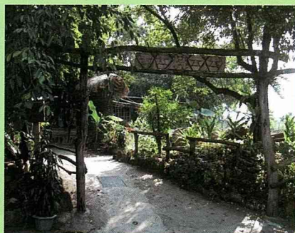
利用樹幹搭起簡單的「隘門」，以凸顯基地入口。