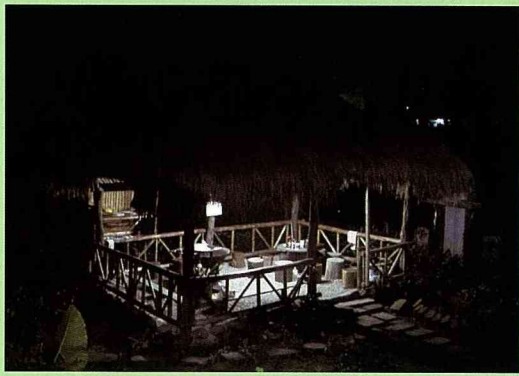
幽靜的山中夜晚，茅草涼亭內點著燈，歡迎旅人一起來訴說故事。