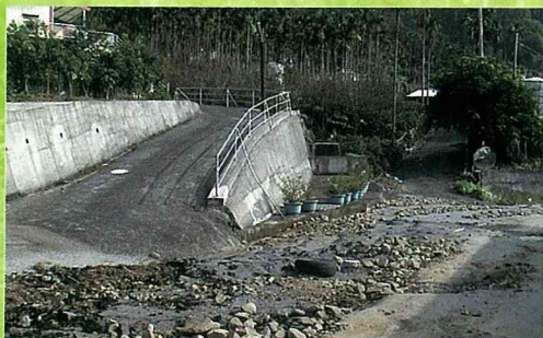
阿里山公路因混凝土及柏油的大量使用，一場豪大雨就會造成路基流失。

不僅牢固且保土功能及水滲透性強，因爲水、土、石牆交融，故石縫間長滿了綠色植物，在四周大樹的庇蔭