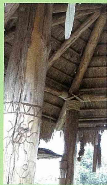
每座涼亭內，木頭上畫著鄒族的圖騰及吊掛著鄒族飾物。

後，屋主運用桂竹、小米與祖先留下的蝸牛殼等來裝飾美化涼亭，更讓每幢涼亭下呈現每家主人不一樣的心思。