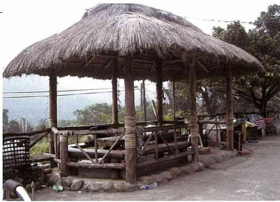
村民家前庭自行搭建的涼亭，提供遊客們一個休憩的乘涼處。