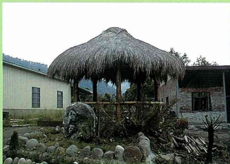
茅草涼亭是茶山村傳統建築文化重振的象徵。