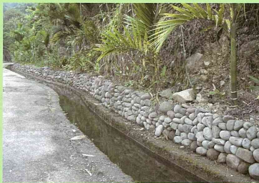
自然的石砌護坡，營造小生物群的棲息空間，側邊的小水溝是生物聚落的生命泉源。