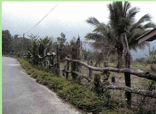
簡單、質樸、自然的相思木圍籬，樹皮自然剝離形成的空隙，變成了小昆蟲的藏身之所。