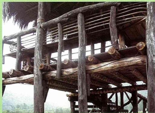
用當地相思木搭建而成的活動中心。