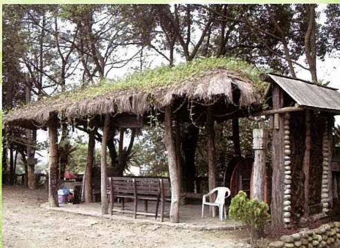
在大自然的滋養下，原本褐色的茅草屋頂，漸漸長出綠色的被覆植物。