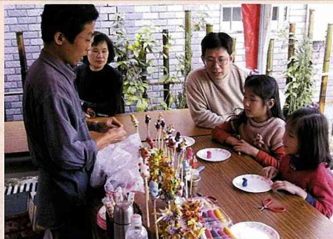
陶藝作業組之捏麵人。