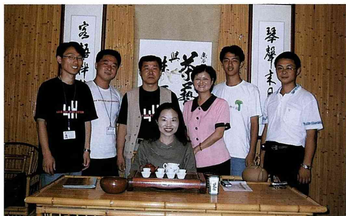
韓國草根大使與接待人員相見歡。

但看到鹿谷在全鄉人群策群力，為鹿谷觀光用力發聲時，那股內在的力量是強大的，只要有人能無私地帶大家向前走，921和桃芝風災的大自然考驗都可以通過，還有什麼不能克服的呢？