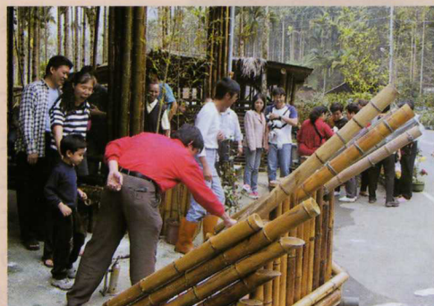
竹筒禮炮製作教學。