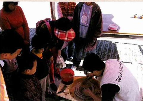
陶藝作業組之手拉坯。