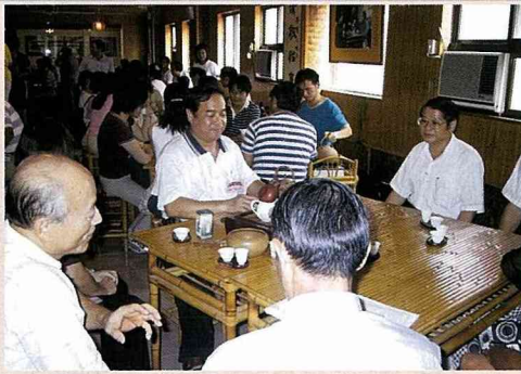
全國教師茶藝研習營。