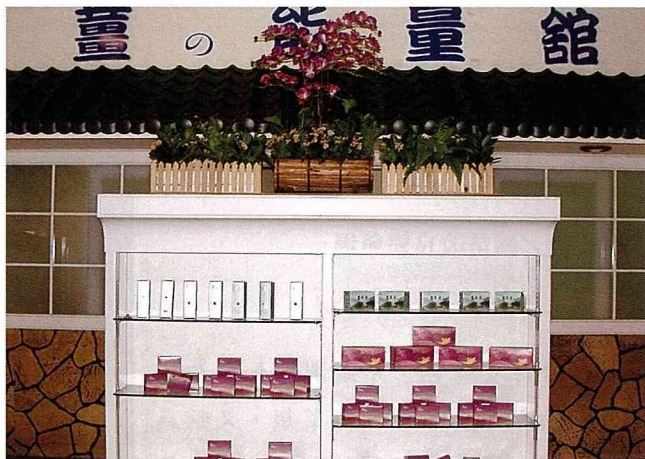
在「薑之軍」產業館內開設「薑之能量館」。

班長把初級農產品的生薑，提升為二級加工品，研發量產系列產品，不僅解決次級生薑的出路，且預防生薑滯銷的問題，為名間鄉蔬菜產銷班第五班的班員們增加收益，改善班員生活，是產銷班經營模式現代化的典範。游班長說，WTO並不可怕，怕的是對自己失去信心，台灣有很多農產品具有市場競爭力，只要肯動腦筋，研發創造，學習改進，台灣農業可以闖出一片天！