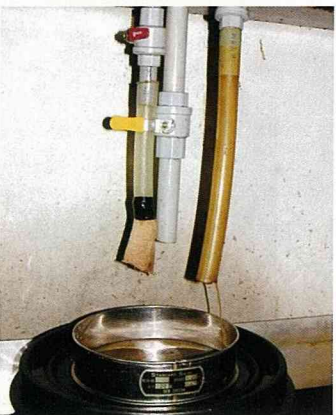
完成萃取的薑汁精油。