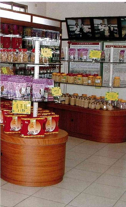
「薑之軍」產業館內部展售陳設。

含的綠色高纖維素，更可以幫您作體內的環保。「名農山珍」中，含有獨特的配方，主要有生薑、山藥（紅薯）等成份，口感很適合男女老少長期食用，為方便消費者食用，分別製成粉末、顆粒狀，您可依照自己的食用習慣，選擇「山珍茶」沖泡式茶包，或「山珍錠」口含片。