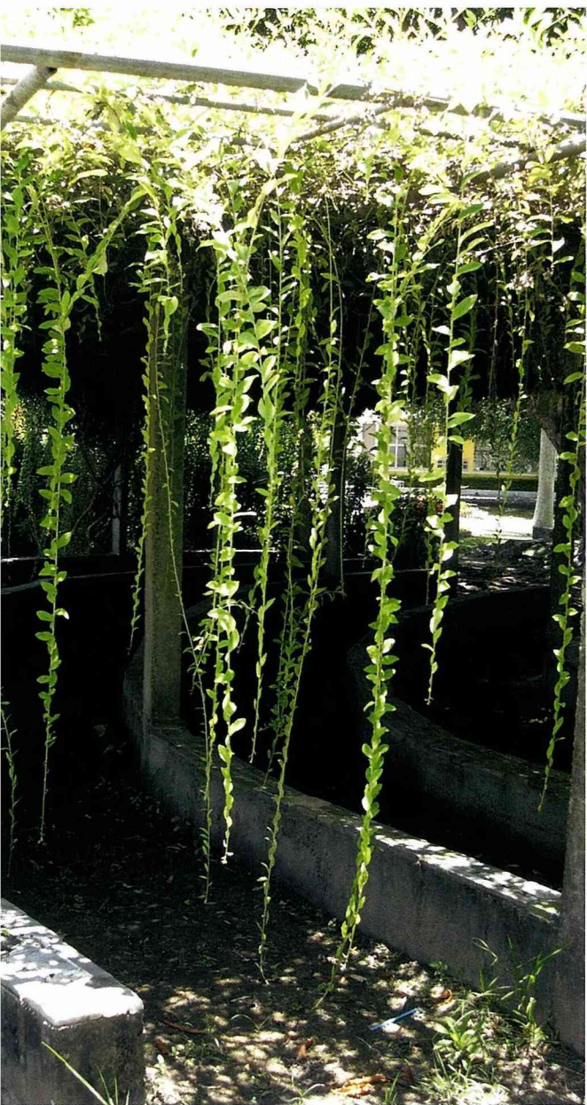
露天教室，綠意盎然。

他說，「景觀」不僅供人類「觀景」而已，而應與人們交流互動，遠眺的景觀，既已保持距離，不妨維持大自然原來的樣貌，讓大樹成為地球的地被；人與自然雖為一體，一旦親近，仍必須考慮人在自然界的安全性與舒適感，此種修飾的手法就是「造園」，造園不是推翻自然，而是學習自然，只是加上人為的創意。