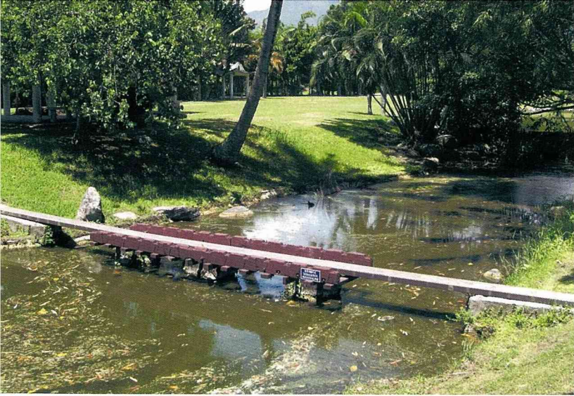
淘汰交通車 的木製龍骨，架在水泥涵管上，成了獨木橋。

務，所獲報酬全部用於教學設備的充實及舉辦活動之用，由於所有賬目完全透明，沒有人謀不臧之虞，既可充裕經費，同時使學生透過技術服務，擁有實際操作的經驗。