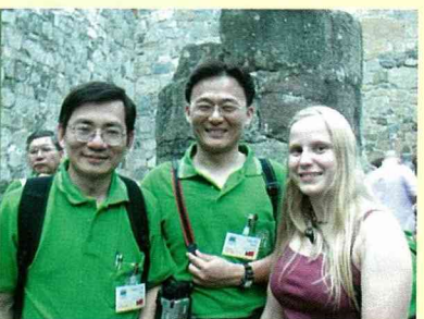
火炬遊行前的歡樂一景。