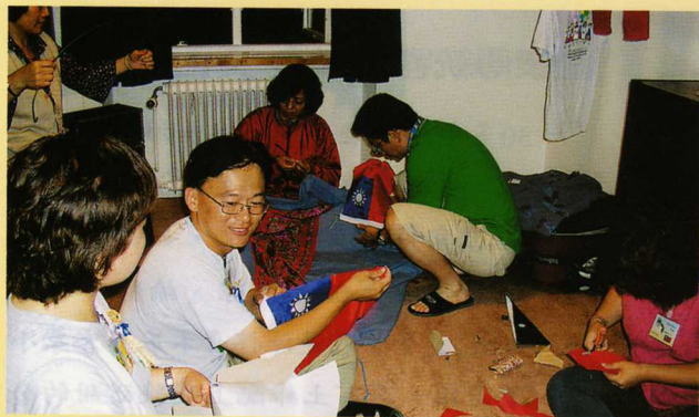
大夥在夜裡趕工製作表演道具。

『國際農村青年交流』是一個在教育農村青少年與外交關係上雙贏的計劃，8天的會議時光，一溜煙就結束，大家相約2008年南澳洲再相見！