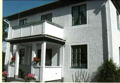
瑞典民宿外觀樸素中帶典雅氣息。