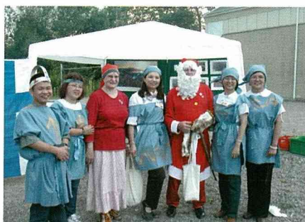
北歐之夜裝扮成的北歐維京海盜裝。

夜夜不夜城。步行大約30分鐘，抵達小鎮的古城堡前，這時太陽才下山，由主辦國的工作夥伴手舉火炬，帶領來自22個國家，471位IFYEs和IFYE朋友們，一同再步行15分鐘，抵達小鎮教堂，舉行開幕的祝福儀式。在傳統的管風琴樂聲伴隨下，大家靜靜的坐在教堂接受神父的祝福，正式展開這5年一度的活動。