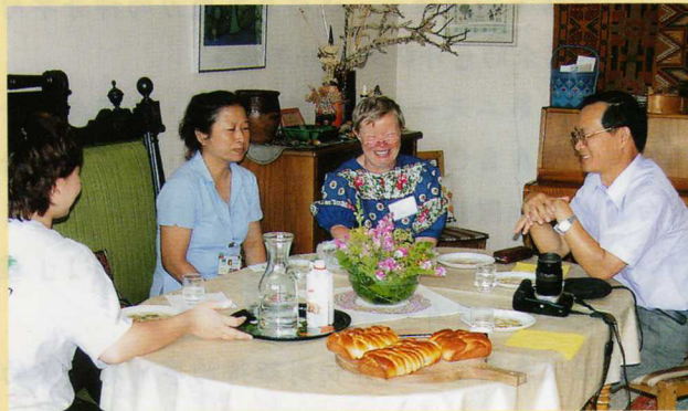
來到Host Family小歇分享國情生活。