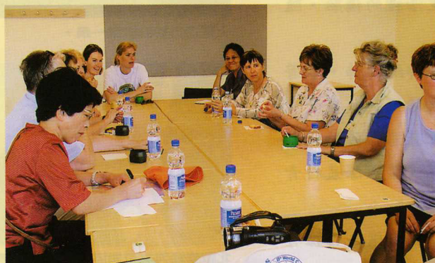
分組會議一景—兩性平等議題小組。