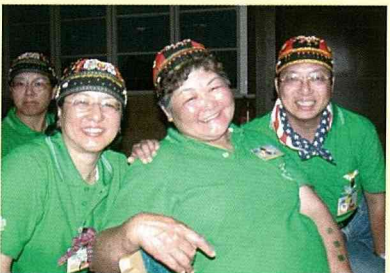
等待晚會時的合影。