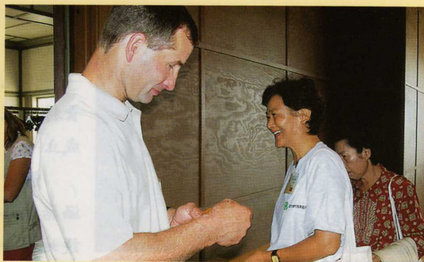
大會開始前，分發台灣相關文宣，介紹我們的國家。