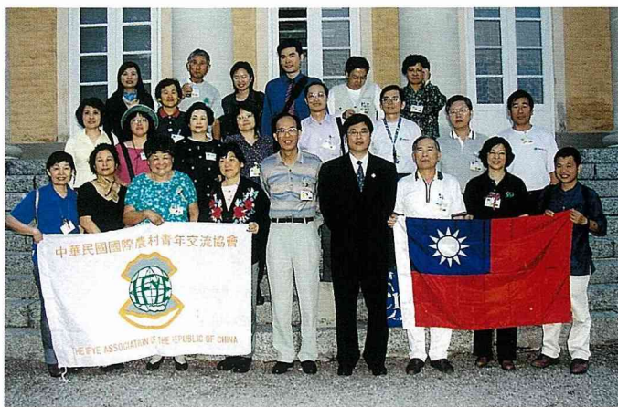
團員與我國駐瑞典代表處馬秘書等合影。

飛抵瑞典首都斯德哥爾摩後，再搭乘1個多小時往北的車程，抵達會議地點——西格圖那 (Sigtuna)，一個以瑞典國王創辦的西格圖那大學爲主的3,000多人小鎮，沿著山坡建築的校園，環湖而立，青蔥蒼翠的森林樹木，空氣中飄蕩著一股淡淡的恬靜清香。