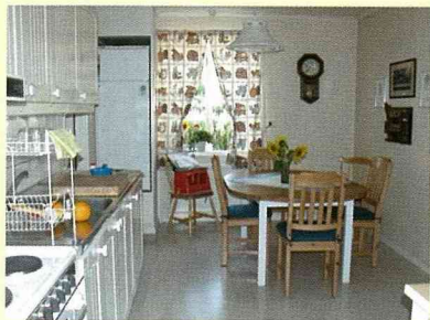
瑞典民宿中的擺設。