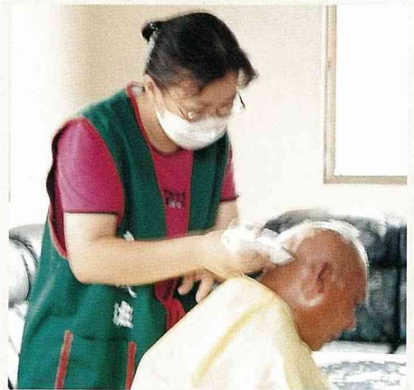
替獨居老人刮鬍子，或理頭髮，都是居服員的工作項目。