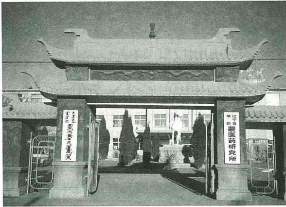
蒙醫藥研究所享有國際聲譽。

政府批准為省屬衛生科研單位。經過20多年的發展，蒙醫研究所已有450多名職工，其中85%為蒙古族。住院床位有上百床，X光、B超、化驗、心胸電圖、激光、理療等輔助醫療設備齊全。蒙醫研究所確立以振興蒙醫、奮拓蒙藥和為各族人民健康服務的宗旨，制定了以科研為先導、醫療為重點、辦好教學和做好藥廠的辦所發展方針。蒙醫研究所走科技之路，科技研發是該所的主體工作。