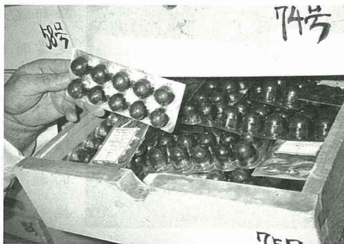
蒙研所有豐富的藥草資源。

不久前，作者受邀到阜新蒙古族自治縣參訪，也前往蒙醫藥研究所參觀，感覺到蒙古族的文化，真是多采多姿，源遠流長，民族瑰寶蒙醫藥更是博大精深。「蒙古貞」乃是阜新縣的古稱，位在遼西的阜新蒙古族自治縣，全縣總人口約74萬人，向來享有「蒙醫蒙藥的搖籃」和「歌的海洋」