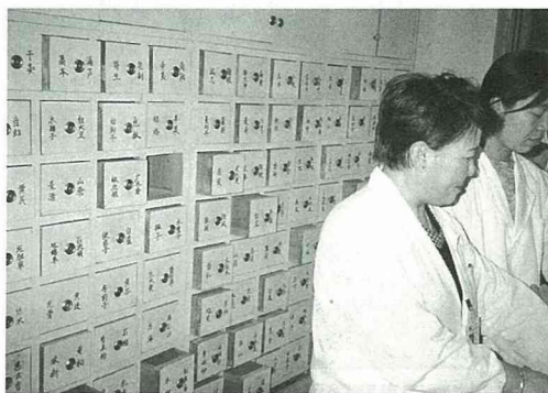
現代化包裝的蒙藥丸。

位在阜新縣的遼寧省蒙醫藥研究所，始建於1979年，1981年竣工開業。1988年7月，獲得遼寧省