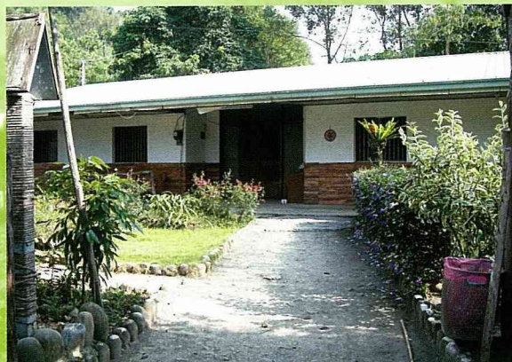
利用農宅閒置空間經營民宿。