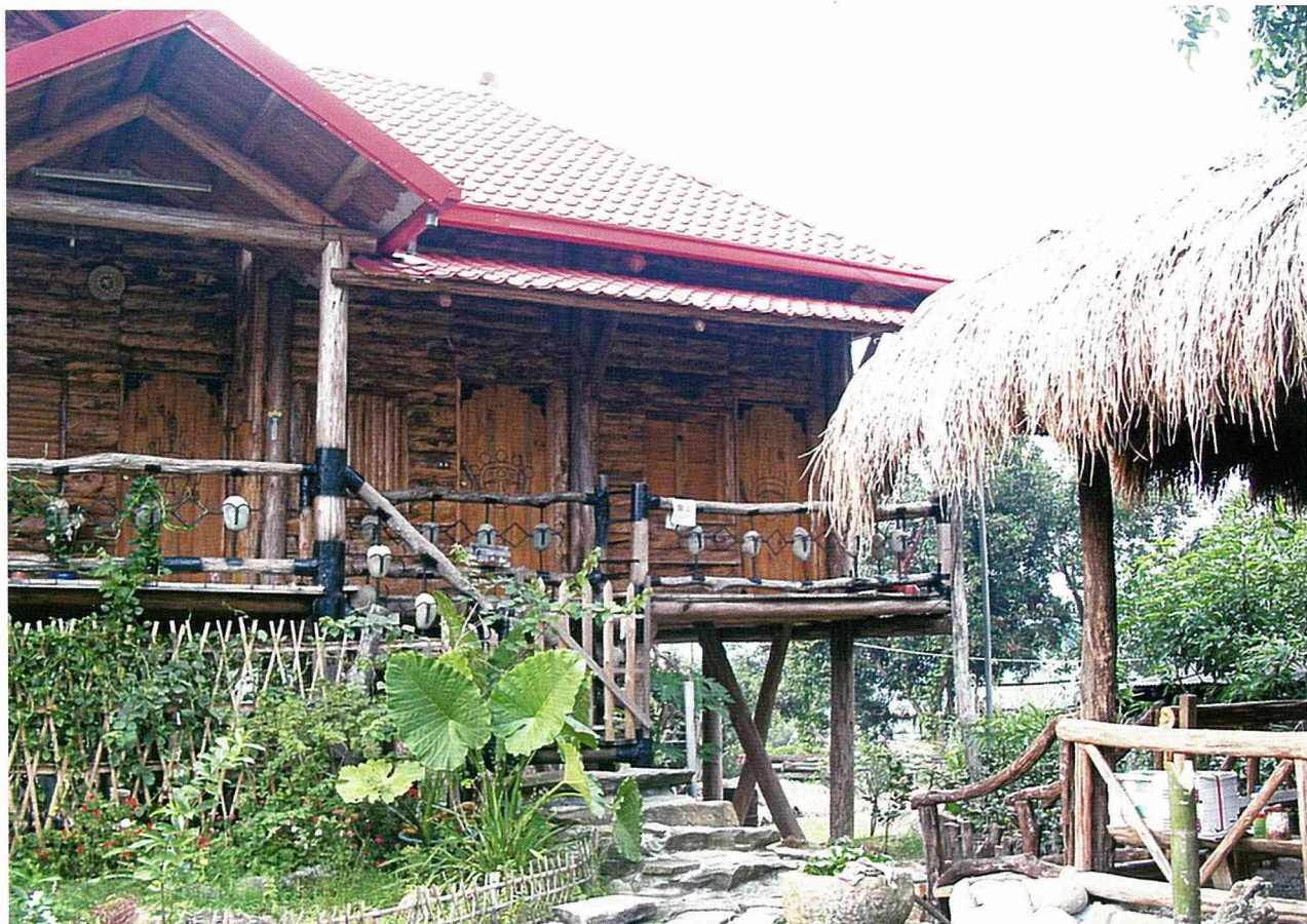
兼具生態及野趣的庭院空間。

坐在茅草涼亭裡更可以觀賞到庭院裡的花草、水塘甚至還有野生動物，一幅自然美景就在眼前。