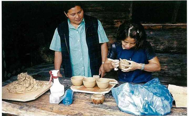
茶山村民都要有一技之長，玩陶是其中一種。