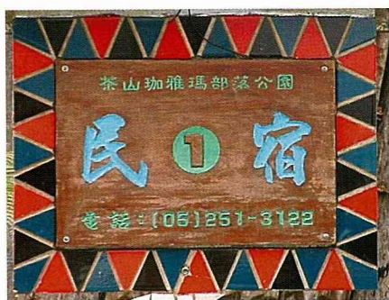
具有原住民特色的民宿標誌。