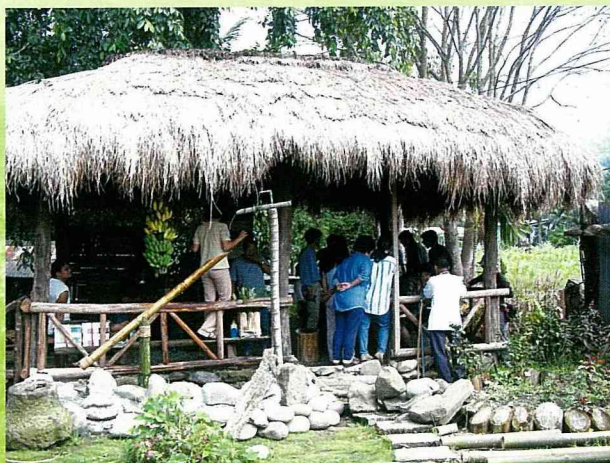
提供鄰居及旅客休憩聊天的茅草涼亭。