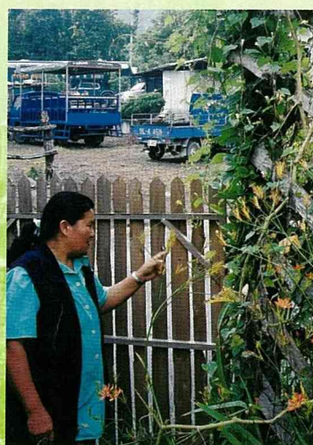
在地人最熟悉在地生長的植物，是最佳解說人選。