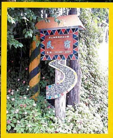
具有原住民特色 的民宿標誌。

美麗的茶山村，多族群共生的機制早已建立， 如果世界還有紛爭喧擾，茶山將是最後的淨土。