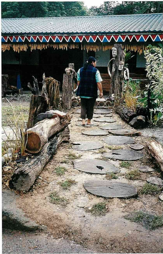
這戶人家打掉門前水泥路，重新設計木質鋪面，顯示生態意識在茶山村已經覺醒。