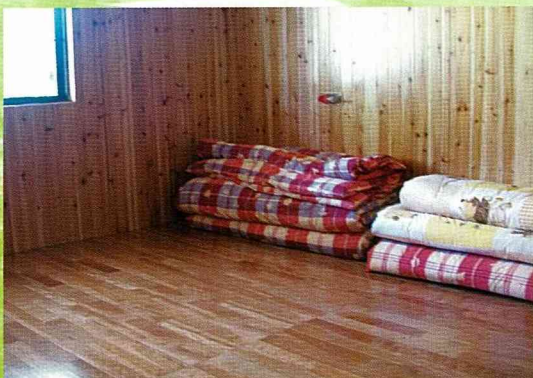
利用木材裝修的通舖空間。

茶山村民宿大概可分為通舖及套房兩種，以地板通舖形式居多，部份民宿是將住家多餘空間規劃成客房，這種民宿空間