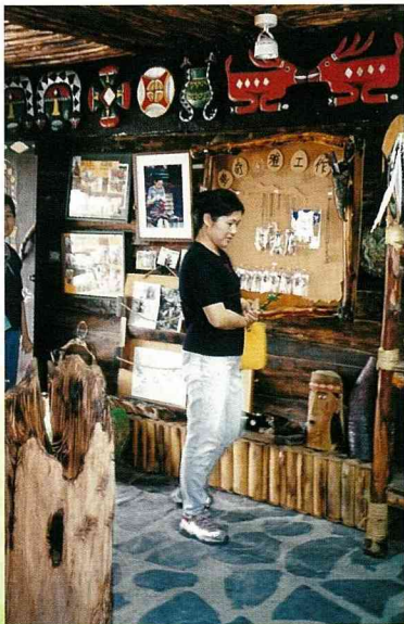
生活化的文物工作坊，是吸引遊客駐足的賣點。