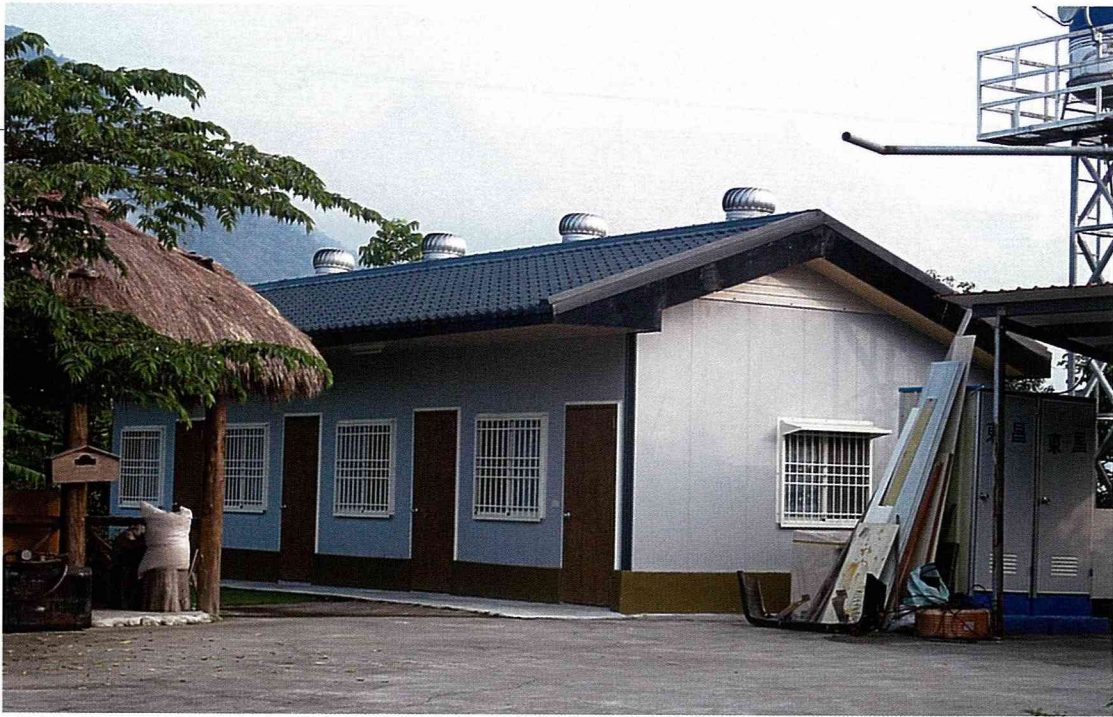
現代化的民宿建築外觀。

大相逕庭。舉例來說，民宿的兒童遊憩空間、家庭聯誼場所、房東與房客之間互不干擾的私密性，均與旅館客房的設計不同；此外民宿的出入口與彼此居住空間的安全性，更是不可忽略的規劃重點。