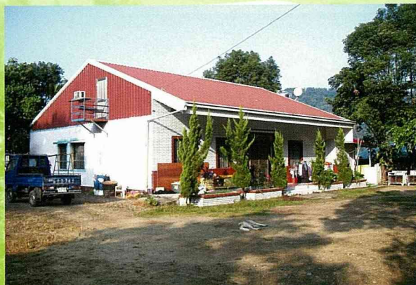
利用農宅閒置空間經營民宿。