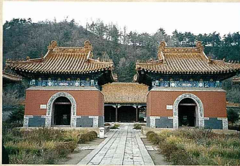
關外第一陵「清永陵」已向聯合國申請列入世界文化遺產。