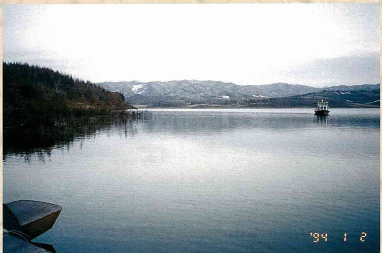
新賓縣為生態示範縣，此處為水質清澈的紅升水庫。