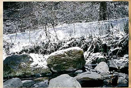
透明塑膠布圍起的「白色長城」。

在多年的封山育林後，林蛙也會遇到老鷹、貓頭鷹和貂等天敵的捕食，因此在2到3年的林蛙成長期間，會有不少自然損耗。但是，許多農戶考慮到養殖林蛙的經濟效益，比種玉米或稻米來得較好，所以還是喜歡飼養林蛙，現在新賓縣一年雌蛙的總生產量多達3,500萬隻。另一方面，由於