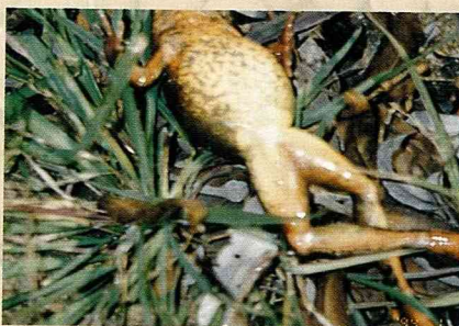
剛捉上岸的雌林蛙，碩大的腹部贏得黃肚囊之稱。