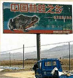
新賓滿族自治縣以放養中國林蛙而著名

中國林蛙與飛龍、熊掌和猴頭（菇），同列為東北四大珍寶。遼寧省撫順市轄內的新賓滿族自治縣，所產林蛙的品質與產量皆屬上乘，為食療兼具的養顏養生補品。