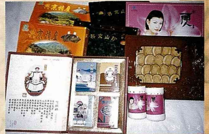
美容養顏的林蛙膠囊，與黑木耳、榛蘑、山參等並列為新賓縣特產。