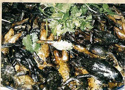
大陸人吃林蛙，油、卵、皮、骨、肉，全部能吃。