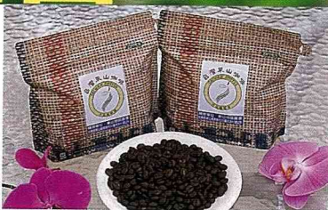
丹品咖啡園出品的有機咖啡。

據學術單位調查，咖啡樹在台灣最適宜生長的环境，以北迴歸線與南迴歸線之間為最佳，在此區域內，也是全球咖啡的主要產區。在台灣三大咖啡的產地中，海拔在700公尺～800公尺間的「崁頭山咖啡」，得天獨厚位處於全球咖啡帶中，因而所生產