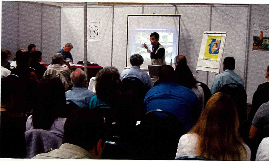
在分組工作坊中，台大王鑫教授介紹了我國國家公園的義工服務制度。