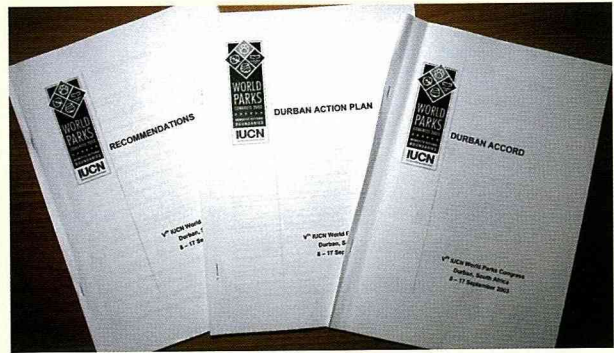
大會三份重要成果文件：「德班協定」、「行動計畫」和「建議」。

所有的大會產出都不和任何政府、非政府機構或世界保育聯盟(IUCN)及其會員有法律關係；而是與會者貢獻他們所能以及與會的過程來倡導、指引及影響全球保護區的正面活動。這些重要成果是您的貢獻，我們希望您將在未來保護區工作場所發現它們的影響，也希望10年後再碰面，能看到我們在德班努力的影響。