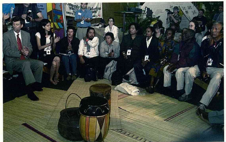
展覽場的中央設有「社區公園(community park)」，提供來自各地的領袖和代表互相對話的場所。