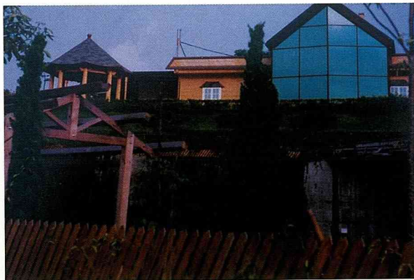
江澤休閒民宿有一大片紅番薯園。

原生種的口味也比改良種香醇爽口，肉質更Q。紅番薯的吃法和一般甘薯相同，除了有趣的煙紅番薯外，煎煮烤炸皆宜。