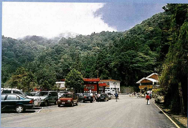
杉林溪重新開園迎賓。

88年受「921」大地震及「桃芝」風災侵襲，致溪阿公路安定彎段坍毀而封關的杉林溪森林遊樂區，在92年8月30日舉行「安定隧道」通車典禮後，重新對外開園迎賓，期能恢復溪頭、杉林溪旅遊線的生機。