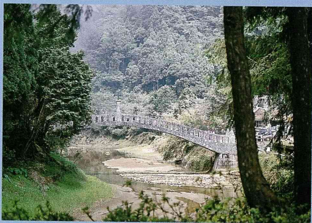
杉林溪的景觀如往昔一樣美麗。