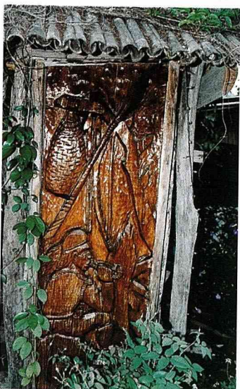
失去獵場的獵人。