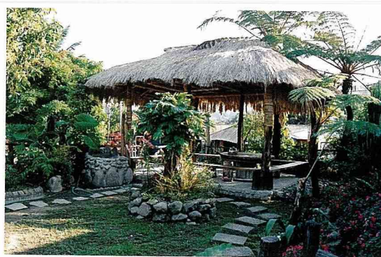
茶山村戶戶有涼亭。