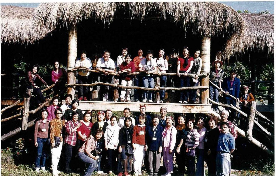
新莊社大「原社民之友社」在集會所前合影留念。

山腰上的平原-茶山村，避隱在山谷盆地中，青山環繞，綠樹成蔭的山谷盆地，除了擁有豐富的自然景觀和清新的空氣外，沒有?魚、沒有溫泉，似乎很難找到「特殊