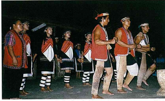
鄒族傳統歌舞。