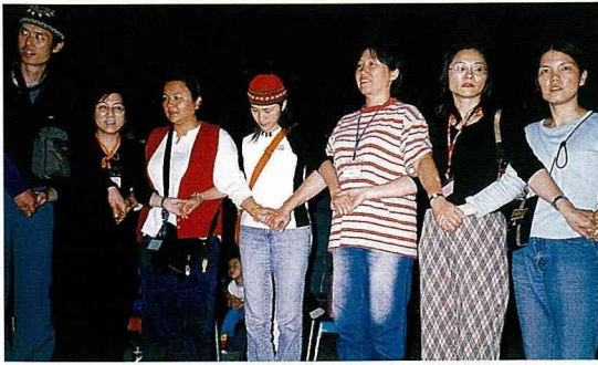
新莊社區大學同樂會。