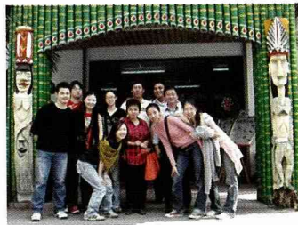
原住民工作室入口的木雕作品。

之後，我們繞了約15分鐘的山路，那是鮮少人會到的地方，因為連地名都沒有，除非有當地人導覽，否則再去一百次也到不了，但那裡的確值得去一探究竟！因為可以俯瞰太麻里溪入海，還能一覽太麻里全鄉的景色。我們也在那認識了一些特有植物，例如：以前很討厭的鬼針草加上車前草一起煮，是一種很好的消暑飲料；火炭母吃起來酸酸的，還能治咳嗽；到處可見的那種紫色小花原來叫「紫花霍香薊」；植物中唯一含有石英成分的五節芒，它的花、根、葉都有特殊功用，據說鄭成功的軍隊困在深山中，就是靠著五節芒的葉