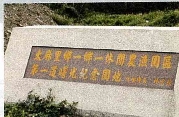
千禧年迎曙光紀念碑。