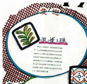
孔雀之珠，代表愛戀。