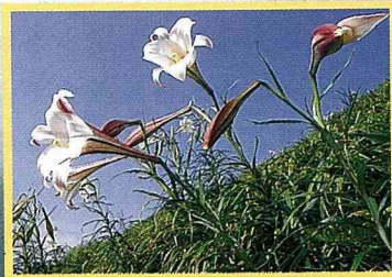
金針山上野百合的春天！