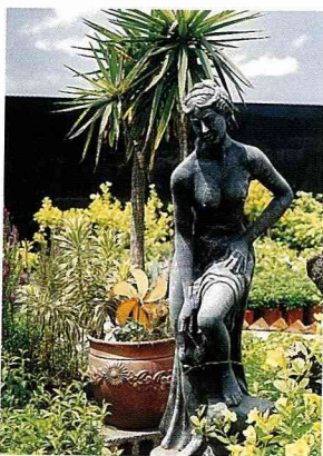
七甲花卉區的園藝造景。

從中山高速公路台南交流道或南二高（國道3號）關廟交流道下來，進入台南縣歸仁鄉境的七甲花卉區後，讓人有一種眼睛為之一亮的驚豔之感。