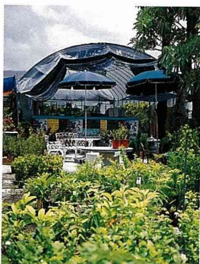
在花園裏享受賞花、吃花的田園樂趣。

美麗的花卉，美化人生。在台灣，提到花卉生產區，人們往往只知道南投縣的埔里、彰化縣的田尾等著名的「花鄉」，其實，南台灣的台南縣歸仁鄉七甲村，花卉產業也有30多年的歷史。尤其，近年來業者為吸引更多的消費者前來，共同籌組「七甲花卉產銷班」，比照彰化縣田尾鄉的作法，規劃成為「公路花園」，提供民眾一處環境優雅的休閒景點，歡渡賞花、買花的美好時光。