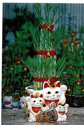
可愛的幸運竹盆栽。