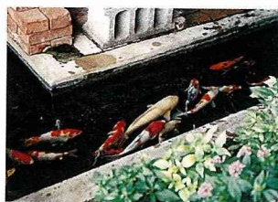
業者在園區養殖錦鯉，增添景觀生命力。