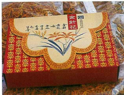
金針禮盒。

最後我帶著滿足和感謝的心，捨不得的離開太麻里！不管最後農會有沒有採用我們的設計與規劃，我還會再回來！回來看看太麻里的改變，回來看看我曾經為她用心絞盡腦汁的太麻里，回來向曾經招待我們的大家拜訪道謝！回來再一次享受這裡的幸福、這裡的美！