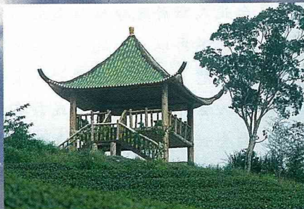
休憩涼亭。