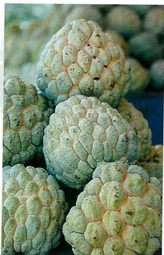
太麻里釋迦。

此次跟隨老師到台東的太麻里，讓我體驗到了有別於都市的生活，雖然這種生活方式不及都市生活的方便省時，但是經過了這幾天，讓我覺得能夠有機會體驗經歷這種生活方式，是很幸福的！