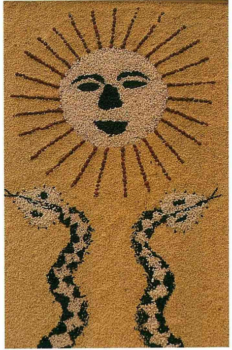
原住民圖騰。

以上，就是我在台東太麻里的遊玩心得，附帶一提，原住民的女孩子真的都很漂亮，我也沒遇到刻板印象中，喜好檳榔，以米酒度日的原住民朋友，但是他們真的都抽很多煙，不管怎麼說，感謝大家的協助，讓我有個印象深刻的太麻里之旅！