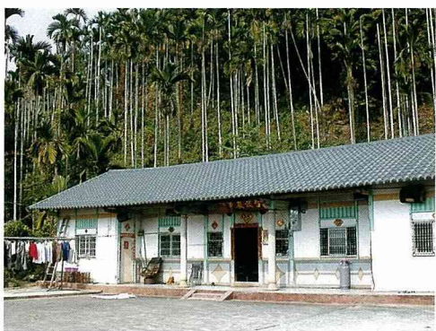
瑞豐靈芝農場 保存舊式農舍