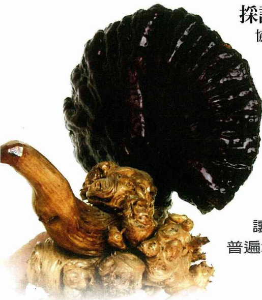
靈芝擺飾品— 「孔雀開屏」