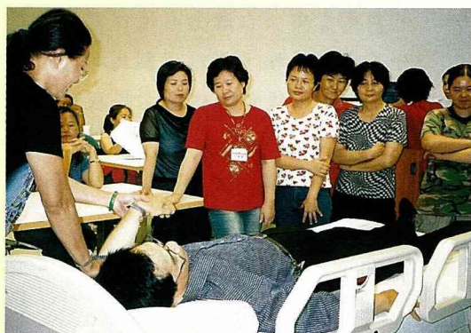
訓練課程-實地操作