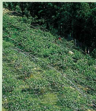
上巴陵陡峭山坡上的水蜜桃園