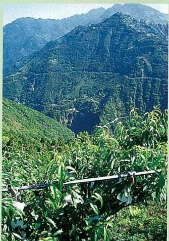
拉拉山向陽坡地的水蜜桃園區

台灣高山地形陡峭，過度墾殖為環境帶來非常大的壓力，造成生態的嚴重負擔。為了讓水蜜桃的種植不要過度集中高海拔山區，從民國69年開始，農業試驗所開始了新的水蜜桃引種、品種改良與育種計畫，以培育種植於低海拔的水蜜桃為目標，引進更多的桃樹品種，並進行雜交育種。桃樹在冬季休眠期必須累積一定的低溫才能在隔年開花，每一個品種需要的需冷量，亦即低溫時數，都不相同；早期自美、日引進的水蜜桃品種都屬高需冷量品種，在溫暖的平地很難開花。