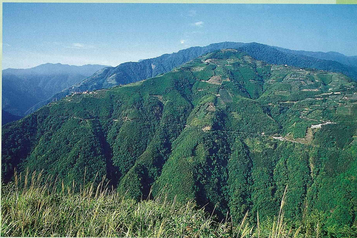
與拉拉山相對的光華是水蜜桃精華區

台中縣新社鄉是台灣最早試種平地水蜜桃的地方，台農甜蜜和春蜜等品種在正式命名之前，就已經在新社展開試種。因為開始得早，又加上環境適合，新社鄉是目前全國最大的平地水蜜桃產區，有廣達360公頃的平地水蜜桃園，