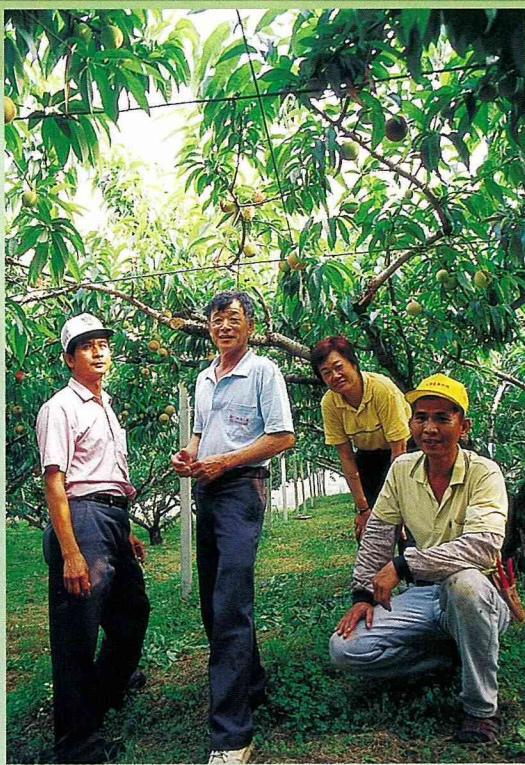
崑山產銷班生產優質水蜜桃