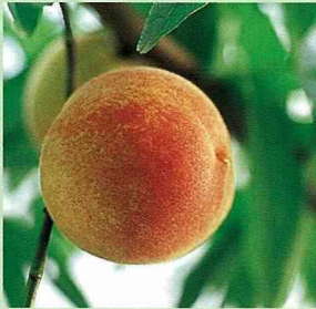
網室栽培的小白 鳳水蜜桃

亞熱帶的豔陽，和冰涼的雲霧， 在台灣高山頂上競賽 拔河，讓來自北國溫帶的水蜜桃， 在台灣高山上結成了嬌貴甜美的果實。