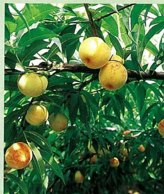
網室栽培的黃妃水蜜桃