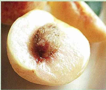
拉拉山小白鳳水蜜桃