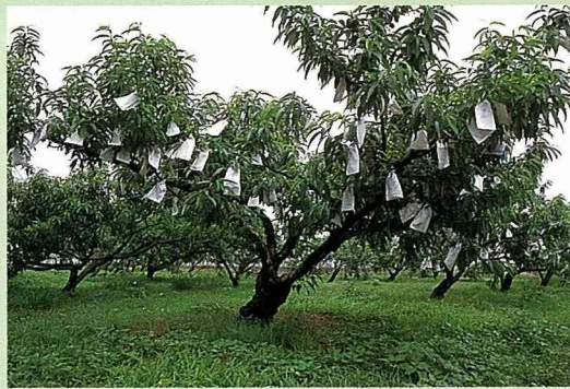
農試所位於霧峰的平地水蜜桃實驗園