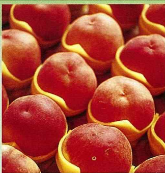
拉拉山大紅鳳水蜜桃