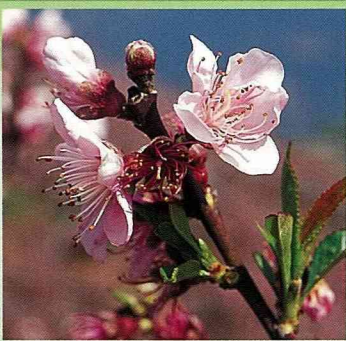
清境的桃花3月盛開