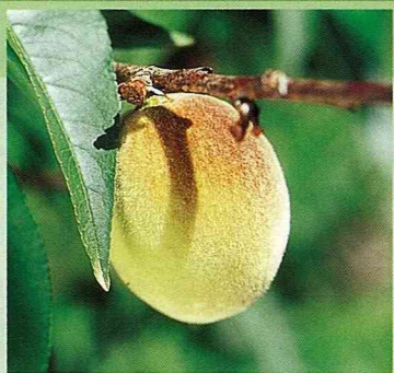
武陵農場的水蜜桃