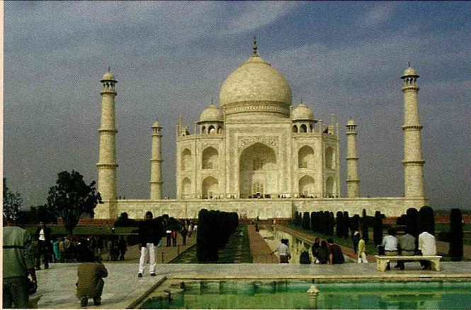
泰姬瑪哈陵為世界七大奇觀之一

除釋迦牟尼佛在菩提樹( Ficus religiosa )下悟道說法外，其餘六佛為莊嚴劫（按：地球經成、住、壞、空，生滅一次叫一劫，莊嚴劫即前一個地球的時代，每一劫有一千尊佛出世）第998尊名毘婆尸佛，在波羅羅( Stereospermum suaveolens )樹下說法；莊嚴劫第999尊名尸棄佛，在分陀梨