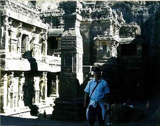
Kailasa神廟的雕刻藝術發揮極致

迦 ( Nelumbo nucifera ；白蓮華)樹下說法；莊嚴劫第1,000尊名毘舍婆佛，在沙羅( Shorea robusta )樹下說法；賢劫(按：賢劫即現在這個地球的時