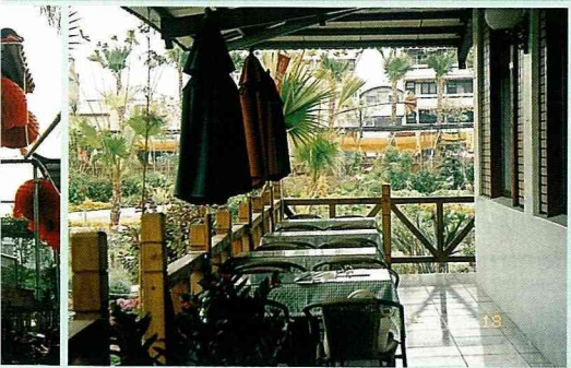
庭園咖啡，鬧中取靜