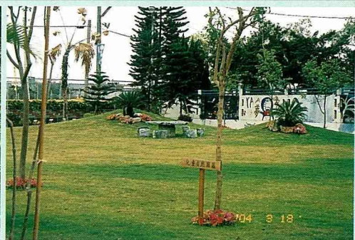
兒童園區，綠草如茵

林場長一向人緣極佳，而且人脈豐富，香藥草栽培方面即得到農業改良場專家的協助，園內香藥草的種類有60多種，植栽排列井然有序，以有機農法栽培，讓遊客在園區享用養生茶或養生料理都多一份安心。原為市民農園改建的兒童自然園地，綠草如茵，景致典雅，小朋友可以自在地躺在草坪上看藍天，或在草地上打滾玩耍。日月型的水池種植蓮花、荷花等水生植物，園區內設置咖啡座，清風徐來，我彷彿在私密的花園裡享受咖啡香。