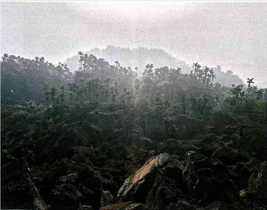
國家級地震紀念地