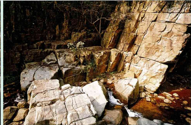
玉門關瀑布的石林景觀

手摘取周遭野生的野薑花葉片，折成杓杯狀取水而飲，其淡淡花香縈繞嘴頰，讓山泉水更添風味。在種瓜坑溪的河域間，棲息繁衍種類眾多的螃蟹與魚蝦，以及會攀岩而上的壁蛙等，自然生態非常豐富，為一處「寓教於樂」的大自然生態教室。