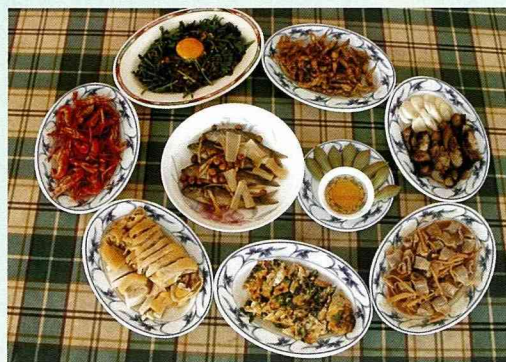
玉門關山莊的客家菜美食

海拔1174公尺高的九份二山，地貌依海拔高度，概略分為三級，海拔高度600公尺以下為鹿場，600公尺～1000公尺為梅樹，1000公尺以上為茶樹。經過1999年「921」地震重創後，原來的高度約降了400公尺，坍塌區高達195公頃，鹿場變成一片黃土，木屐欄溪上游支流的澀子坑溪與韭菜湖溪，也因被崩塌的土石阻斷，而形成澀子坑湖、韭菜湖兩處堰塞湖，以及夫妻石、無底洞、磁場屋、一線天等景觀，崩塌區下的澀子坑，有14戶、39位居民遭到活埋，其中尚有22位的屍體，迄今仍未被尋獲，另也有289頭水鹿陪葬。基於九份二山因地震造成地貌、生態，以及災變形態激烈的變動，在南投縣政府積極推動下，內政部營建署選定此區為「國家級地震紀念地」之一。