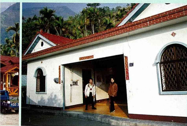
九份二山的磁場屋