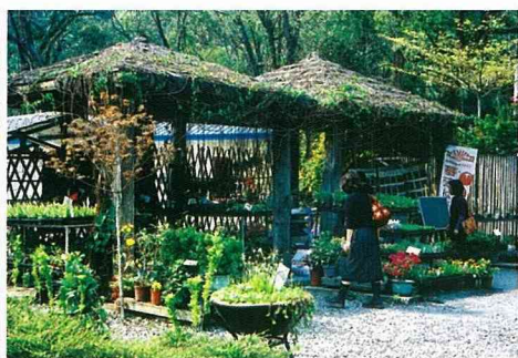
看不見水泥的生態庭院