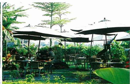
假日座無虛席的庭園咖啡座