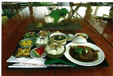
漂流木主廚私房餐