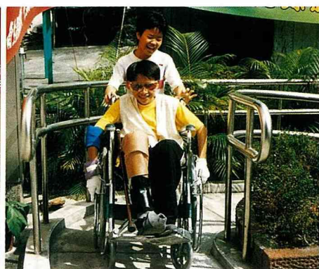
體驗高齡生活，了解老人心理