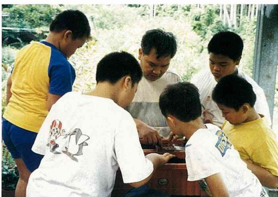
昆蟲世界的奧妙吸引孩童的目光

負責規劃這個作業組的全大哥和施大哥，設計了葉片拓印、學習拍照、田野觀察等活動，帶領小朋友進入神秘的花花世界，等到對花朵有初步認識後，再把廚餘製作及認識新城鄉田野之美加入，讓會員們漸漸愛上自己的鄉土，體會荒野之美。