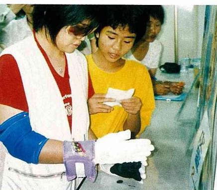
戴上兩層手套後觸覺變遲鈍了

另外，作業組還規劃一些關於「安全急救訓練研習」等課程，教授意外傷害的預防與安全急救等常識與處理方式，讓新秀地區四健會員增加生活常識，培養緊急時的應變能力，也讓會員們學會尊重生命。