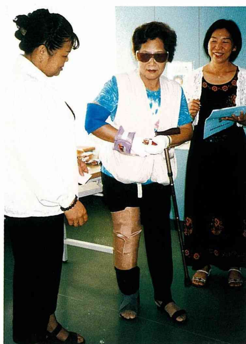
利用容易取得的道具，模擬高齡者行走