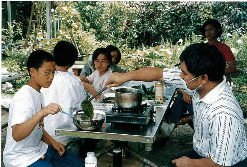
荒野之美作業組～葉片拓印

蟲的反應很兩極化，有的被嚇得驚聲尖叫、花容失色，有的則是愛不釋手，但是經過多次接觸後，大家都愛上這些小生物。施大哥說，也許有人覺得昆蟲很不起眼，但它們卻深深影響人類的生活，它不僅可愛，還有許多值得觀察的習性，只要深入去了解，就能體驗昆蟲世界的奧妙。