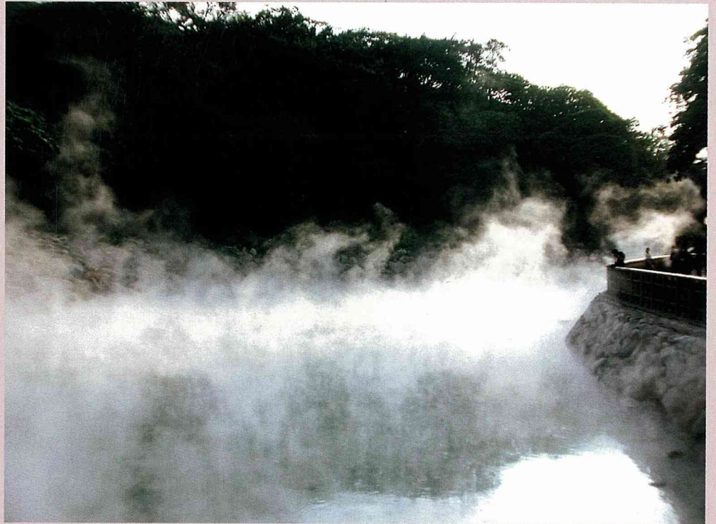
朝陽照射到地熱谷，煙霧瞬間光影隨意變幻

北投溫泉博物館為佔地約700坪的兩層樓房建築，底下一樓為磚造，二樓則採木材建造。北投溫泉博物館的外觀，採取英國維多利亞式樣「洋風建築」的基調；浴場空間設計上，有拱廊、列柱、彩繪鑲嵌玻璃等西洋式的建築，營造出羅馬浴場般的空間感，也讓整