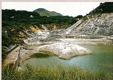
硫磺谷已列為地質景觀區