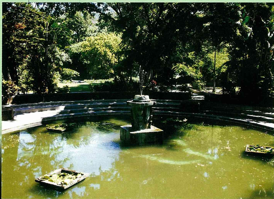
「泉都」鄰近北投公園

其實，隨著北投風化之名日漸沒落之際，國民旅遊風氣日盛的今天，有心重振北投溫泉盛名，發展正派經營休閒渡假的業者，已相繼地在北投地區，投入了相當鉅額的資金，看好往後的觀光事業發展。其中，座落在台北捷運新北投車站旁的「泉都溫泉