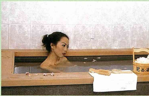
配合岩片檜木的浴池，享受泡湯樂趣