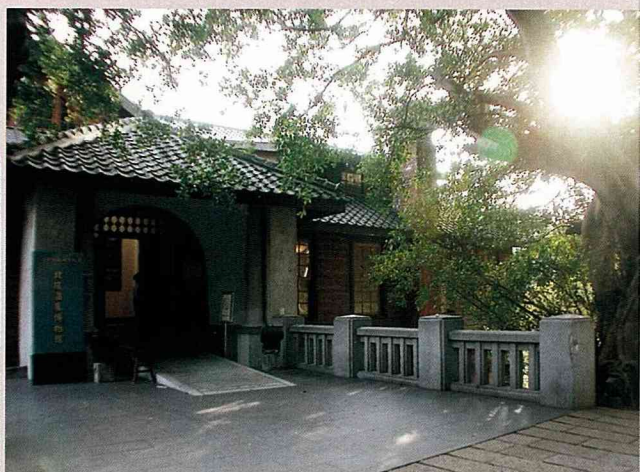
北投溫泉博物館的大門