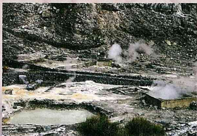
日人曾在硫磺谷開採硫磺