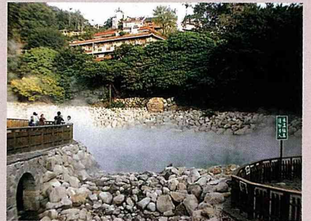
北投中山路盡頭山谷窪地的「地熱谷」