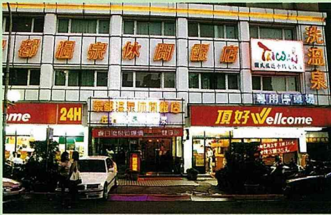
泉都溫泉休閒飯店的外觀