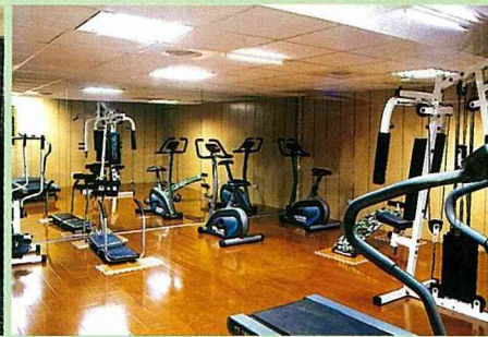
全新設備的健身房