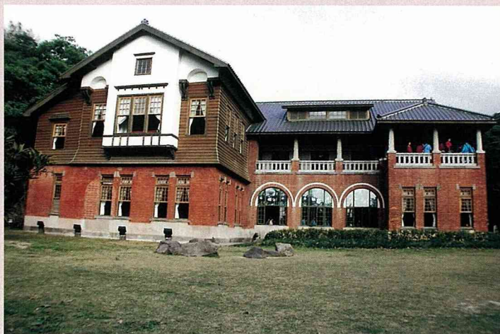
北投溫泉博物館的外觀