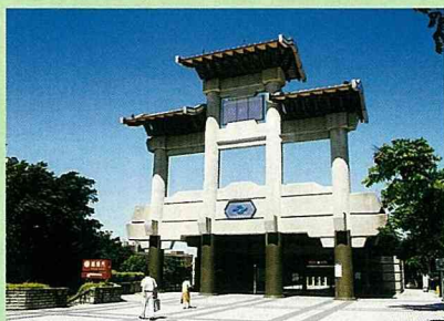
「泉都」座落在台北捷運新北投車站旁

北投呀，春天來時，山有彩霞雲波。 北投呀，夏天來時，蟬兒聲啼送涼。 北投呀，秋天來時，湯船滿載月光與蟲聲。 北投呀，冬天來時，黃金般的花兒盛開。