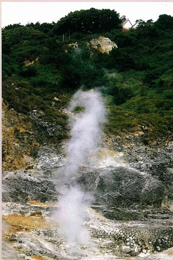
硫磺谷常年熱氣蒸騰白煙繚繞