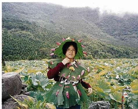
馬太鞍濕地的蓮花田