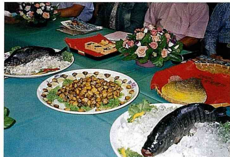
壽豐三寶：(左起)貴妃魚、黃金蜆、台灣鯛

光豐地區農會 03-870-5206 壽豐鄉農會 03-865-3101 瑞穗鄉農會 03-887-2338 富里鄉農會 03-883-2111