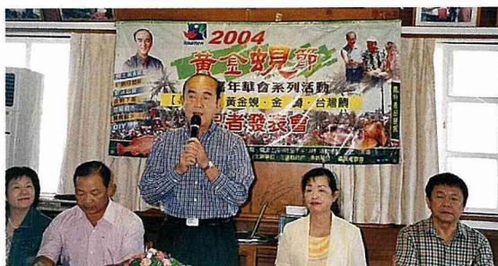
花蓮縣長謝深山大力推薦壽豐三寶

花蓮以「觀光立縣」為號召，暑期黃金檔更是安排琳瑯滿目的活動。花蓮縣政府農業局主導規劃的農漁業產業活動，在暑期檔率先安排的是7月3日登場的「來去蓮合國」；7月31日的「黃金蚬節」、「茶藝節」；緊接著8月中旬的「水牛節」、「金針花季」開鑼，好不熱鬧。期間又穿插著觀光旅遊局舉辦的太平洋左岸「星光大道」、鯉魚潭「水舞音樂季」，還有衛生局邀請糕餅業者製作「台灣No.1花蓮薯與羊羹」。來到花蓮的觀光客，莫不驚嘆「不虛此行啊！」