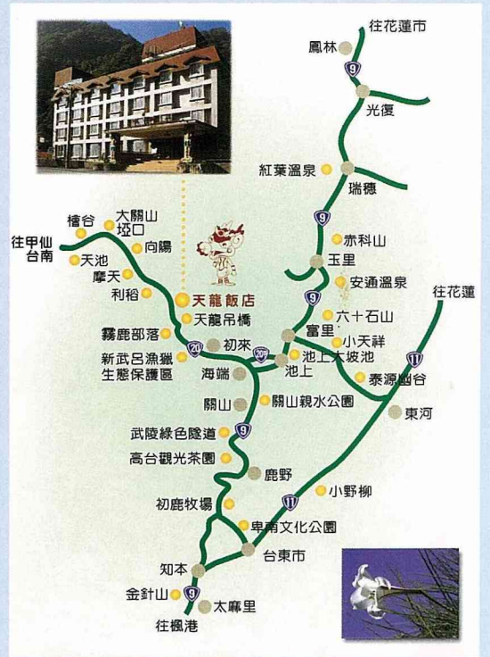
天龍飯店觀光地圖