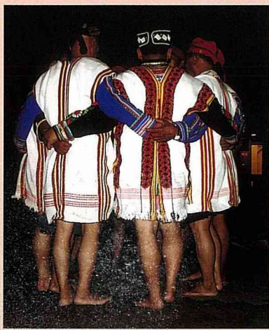
布農族天韻「八部合音」

天龍飯店在夜間活動中，會不定期安排當地的布農族原住民，在飯店前廣場上表演名聞遐邇的「八部合音」。所謂的「八部合音」，就是布農族原住民的祈禱小米豐收歌，它的原名是Pasi-but-but，歌曲演唱時，流露出肅穆、莊嚴、和諧、圓潤的情感，曲子的音調優美，需有8個人以上圍聚合唱，但必須維持偶數，且參加演唱的男子，必須是這一年最聖潔的成年男子。此曲的由來，是最自然的物象之伸延，緣起說法有兩種，第一種說法是來自於蜜蜂群的聲音，第二種說法則是來自於瀑布的聲音。