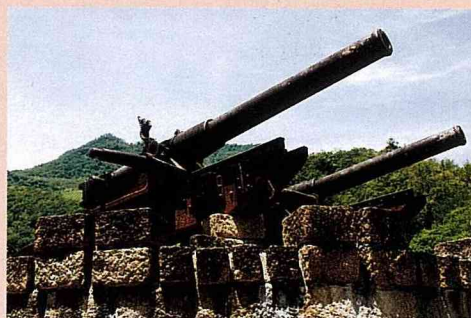
霧鹿砲台紀念公園裏的兩座古砲

霧鹿部落，地如其名，長年薄「霧」籠罩，野「鹿」優遊山林間，且部落居高臨下，可以俯瞰新武呂溪壯麗的峽谷景觀。在台灣光復前，曾經有布農族的原住民，在此演出可歌可泣的抗日事件歷史，而蘊藏著珍貴的布農族史蹟，放置在「霧鹿砲台紀念公園」裏的兩座古砲，就具有觀光旅遊與學術研究的價值。