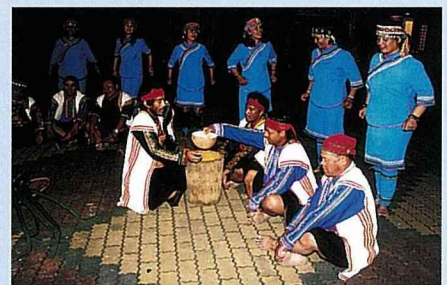
廣場上布農族傳統歌舞表演