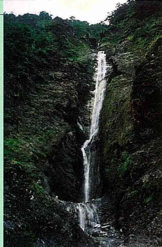
埡口大關山的飛瀑

天池，是地名，也是池名。位在海拔2280公尺的庫哈諾辛山支稜上，是南橫公路上重要的地標據點之一。面積約700平方公尺的天池，從箭竹林草坡往下看，天池正好為一心形，好似一面明鏡，山林美景，盡入鏡中。天池附近曾多次遭受火災，形成台灣二葉松的枯木景觀，並有不少未被燒燬的馬醉木、紅毛杜鵑、玉山箭竹，重新抽芽生長；每年5～8月為台灣百合、毛地黃的花季，將綠草坡妝點得美麗動人。