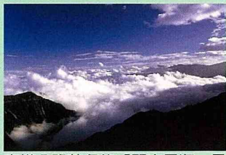
南橫公路著名的「關山雲海」景觀