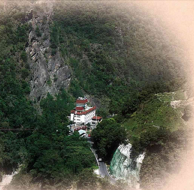
霧鹿峽谷旁的的天龍飯店