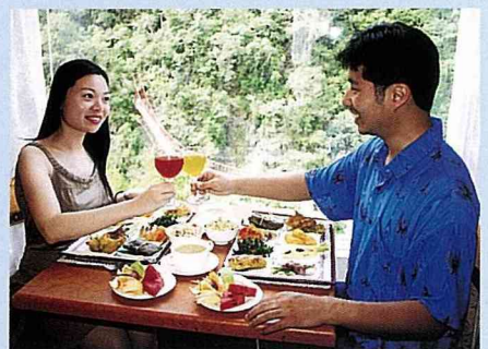
精緻的天龍套餐美食