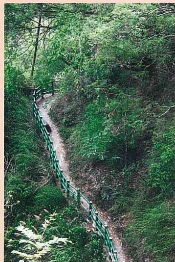
南橫古道規劃為布農族生活植物步道