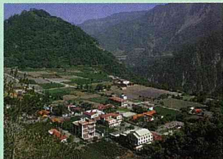
利稻為布農族原住民聚居的部落