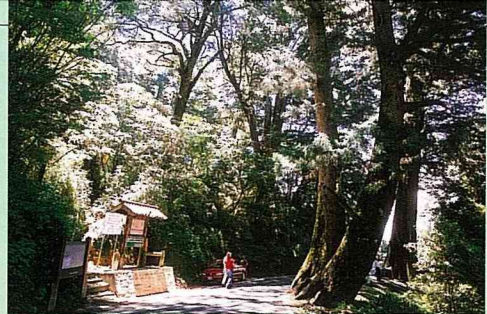
「槽谷」擁有千年巨大的檜木群

高 山、峽谷、雲海、老樹、溫泉、吊橋，再加上春季的花海，炎夏裏的大小瀑布，晚秋的層層楓紅，寒冬的銀白雪景，南橫（台20號）公路四季的景觀，各有其特色，沿途高山峭壁斷崖，翠綠清新的原始森林，景色非常壯觀秀麗，是一條充滿自然生態、原住民文化之美的景觀道路。