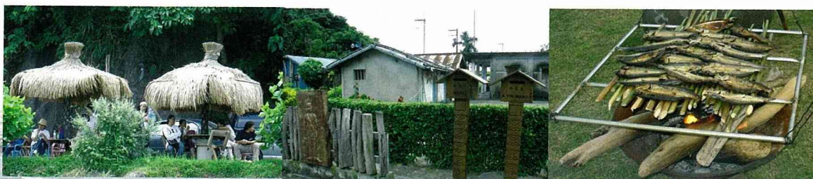
花蓮縣豐濱鄉港口部落的原住民社區，總體營造的結果給人一種安祥寧靜的歸屬感，而綠化和海洋所帶來的震撼力，讓都市人驚嘆不絕。