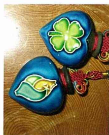
四健與田媽媽吊飾

交趾陶與鶯歌陶的差異，在於交趾陶必須分兩次進窯，第一次先用1100度高溫燒成白胚，待作品上袖後，再進窯以1000度燒製；而鶯歌陶通常只以1200度高溫燒製一次。