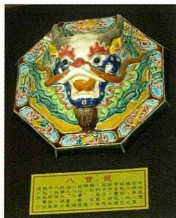
交趾陶藝品—八寶龍