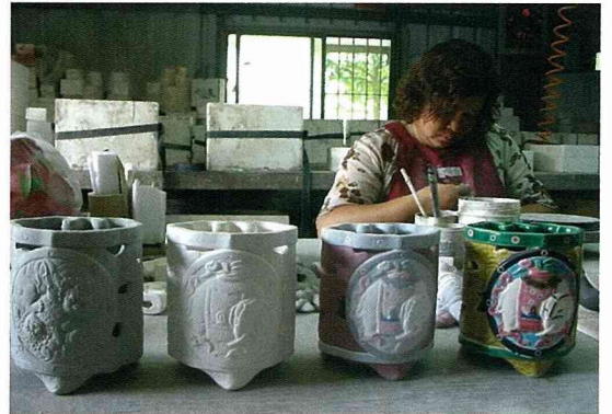
陶坊的成立提供了社區婦女就業機會