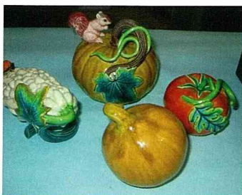
六腳鄉特產蔬果—苦瓜、南瓜、洋蔥、番茄

製作交趾陶時，通常注漿2小時後可倒脫模，再組合小配件，隨著造型難易程度的不同，所需花費的時間從幾分鐘到數小時不等，此時稱為土胚。土胚必須用塑膠袋包好再放在架上陰乾，全乾之後再進窯裡，之後再上袖。上袖的過程中，要考慮到袖彩會在進窯時受高溫影響而變色(例如:進窯前為黃色，袖燒後則呈現出紅色)，因此先將顏色加以編號，經過多次試驗後，才能將最好的顏色組合固定下來。