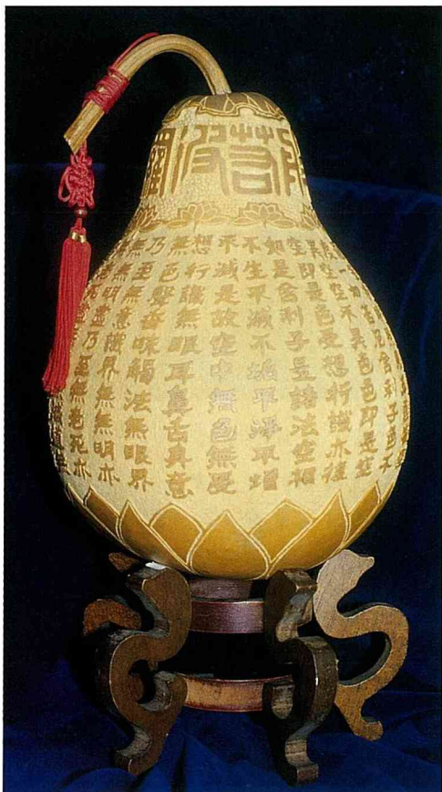
蒲雕「般若波羅蜜多心經」全文(江宗慶作品)

在華人地區，由於葫蘆諧音近似「福祿」，被認為具「祈福納吉」的象徵意義，一般民眾亦相信「風水」之說，因而葫蘆也常被認為具有「避邪化煞」之功用。