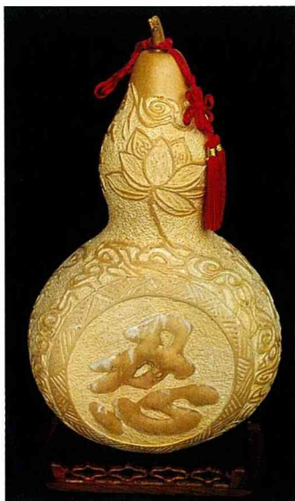
陽雕技法「忍」(江宗慶作品)