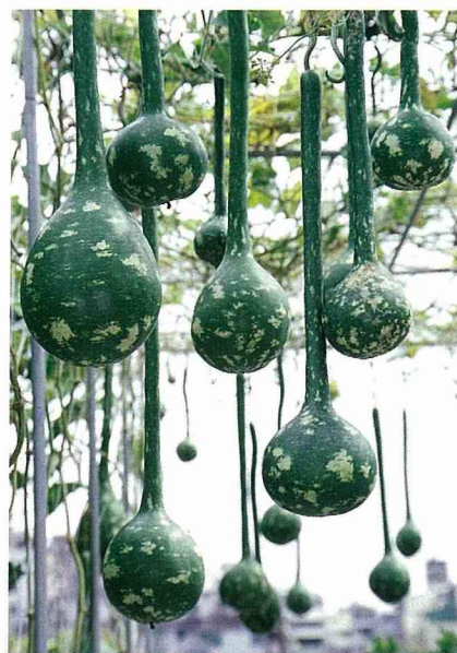
用途很廣的長柄葫蘆

華夏民族利用扁蒲作為生活器物之證據，可遠溯自新石器時代，其後散見於各典籍或生活用語，如《詩經》中所謂「七月食瓜，八月斷壺；匏有苦葉；甘瓠累之」；《論語》中生活過得極為清苦的顏回，靠著「一簞食，一瓢飲」過生活；《莊子逍遙遊》中所討論的「五石之瓠」，雖然不能「以盛水漿」、「剖之以為瓢」，但至少可用於「為大樽而浮乎江湖」。還有，成語「懸壺濟世」中的「壺」即為盛藥的葫蘆；道教中有名的酒肉和尚「濟公」，一手執破扇，腰間掛著裝酒之葫蘆，懲兇行善，留下許多傳奇