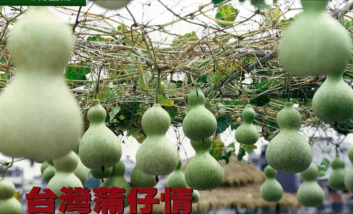
觀賞或工藝用途的苦味葫蘆