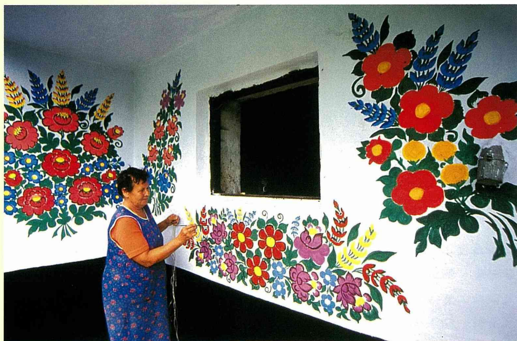
花卉是薩利派婦女最愛的素材

波蘭的薩利派小鎮，以婦女繪畫聞名於世，居民約200戶，男士們以農為業，女士們則個個都能「提筆揮毫」，美不勝收。