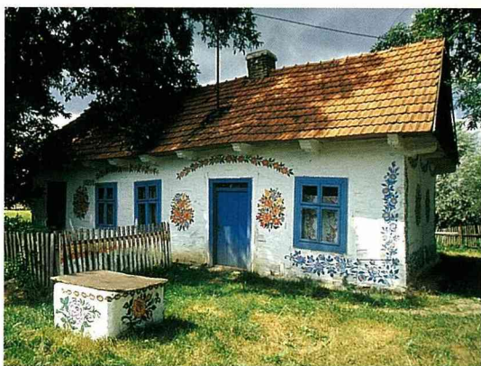
保存完整的傳統農舍

些具有藝術天賦的少女來到教堂，將傳道的講壇，繪上一些象徵上帝旨意的圖畫，或將崇拜時所用的神聖旗幟，加添一些星象、曲線或幾何形狀的圖騰，甚至有少數的教會，竟在聖母瑪利亞的畫像上也添繪一些彩色的花圈，使得原本極爲肅穆的教堂變得親切近人。