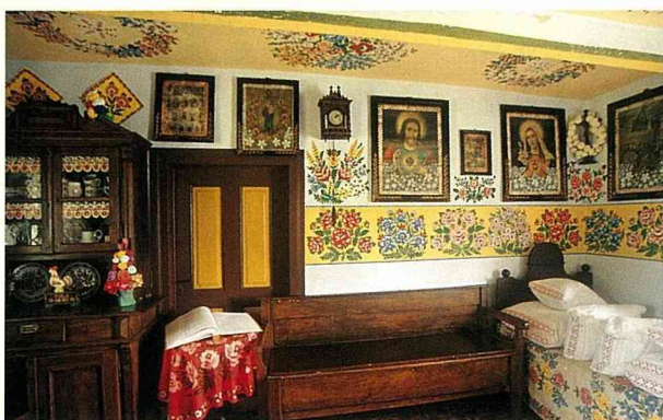
克芮蘿娃女士生前所住房子的內部設計