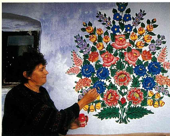
她是當地著名的鄉村藝術家